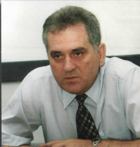
ТОМИСЛАВ НИКОЛИЋ КАНДИДАТ ЗА ПРЕДСЕДНИКА