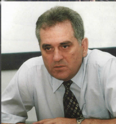
ТОМИСЛАВ НИКОЛИЋ КАНДИДАТ ЗА ПРЕДСЕДНИКА