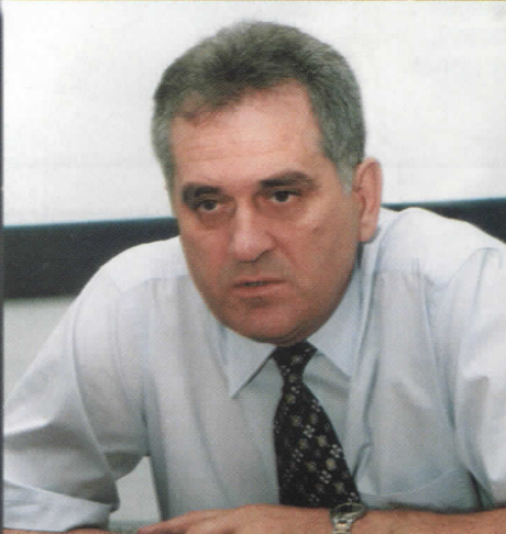
ТОМИСЛАВ НИКОЛИЋ КАНДИДАТ ЗА ПРЕДСЕДНИКА