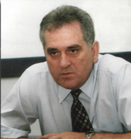
ТОМИСЛАВ НИКОЛИЋ КАНДИДАТ ЗА ПРЕДСЕДНИКА