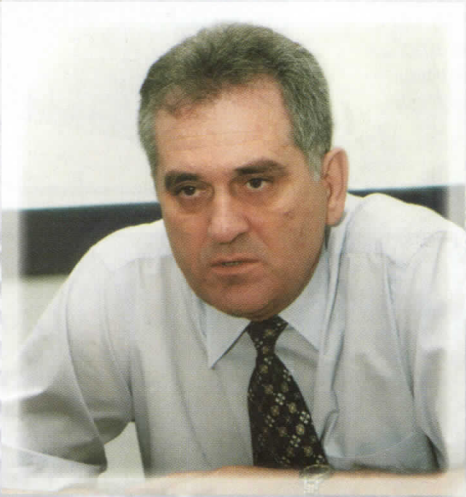
ТОМИСЛАВ НИКОЛИЋ КАНДИДАТ ЗА ПРЕДСЕДНИКА