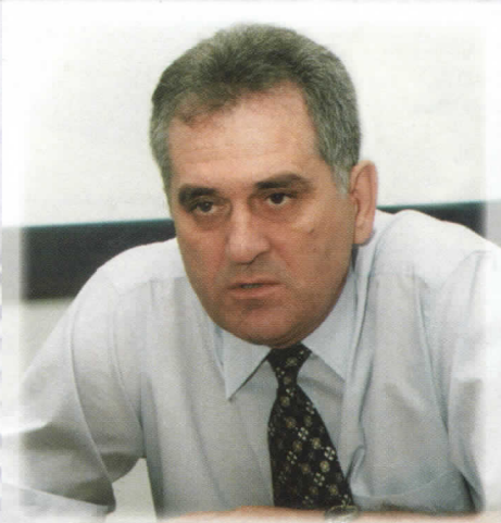
ТОМИСЛАВ НИКОЛИЋ КАНДИДАТ ЗА ПРЕДСЕДНИКА