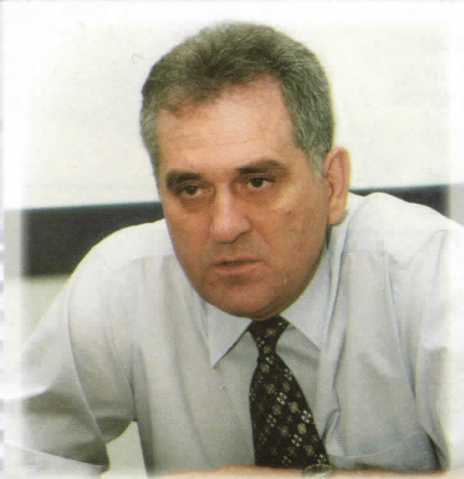
ТОМИСЛАВ НИКОЛИЋ КАНДИДАТ ЗА ПРЕДСЕДНИКА