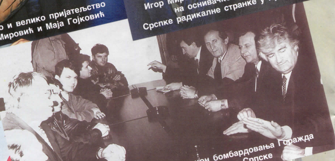
Пале, 3. мај 1994. године, након бомбардовања Горажда са руководством Републике Српске