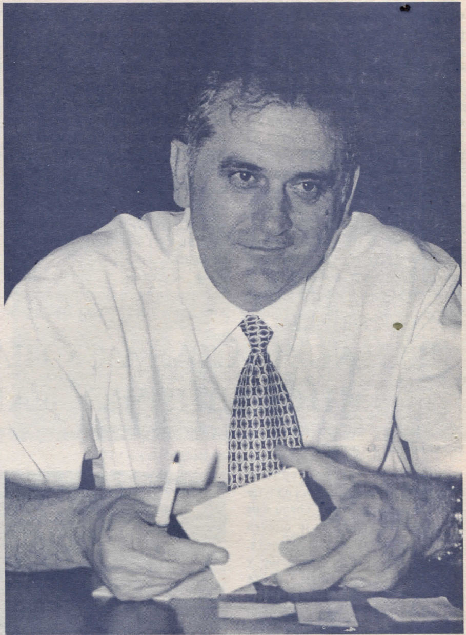
"Рад за отаџбину смисао целокупног живота"

Ево, десет година српски народ има добар правац, али непрекидно подбацује и непрекидно иде из пораза у пораз. Победа Српске радикалне странке на изборима биће једна у низу великих победа које нас очекују. Волео бих да сам и ја данас имао прилику да говорим о неком другом као председничком кандидату, било би их овде много о којима бих могао све