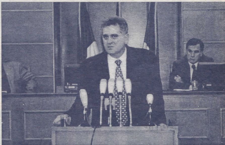
“Политичар коме се ретко може наћи раван”

“Председнички колегијум сматра да је кандидатура Томислава Николића исказивање изванредног поштовања његовој личности, угледу, досадашњим заслугама у борби за одбрану националног достојанства и заштиту националног интереса српског народа, да је израз признања за његов допринос оснивању и развоју Српске радикалне странке, а пре свега, израз уверења да кандидат Томислав Николић има најбоље шансе да заиста буде изабран за председника Савезне Републике Југославије. Целим својим животним путем Томислав Николић сведочи о себи као човеку изузетних моралних вредности, интелектуалних квалитета, способности, марљивости, интелигенције, поштења, части и образа. Поникао у сиромашној селачкој и радничкој породици, пробијао се сопственим снагама