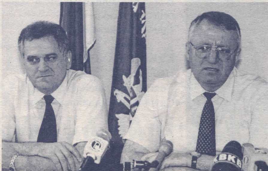
Раме уз раме у борби за српство

Својим ратним доприносом заслужио је звање српског