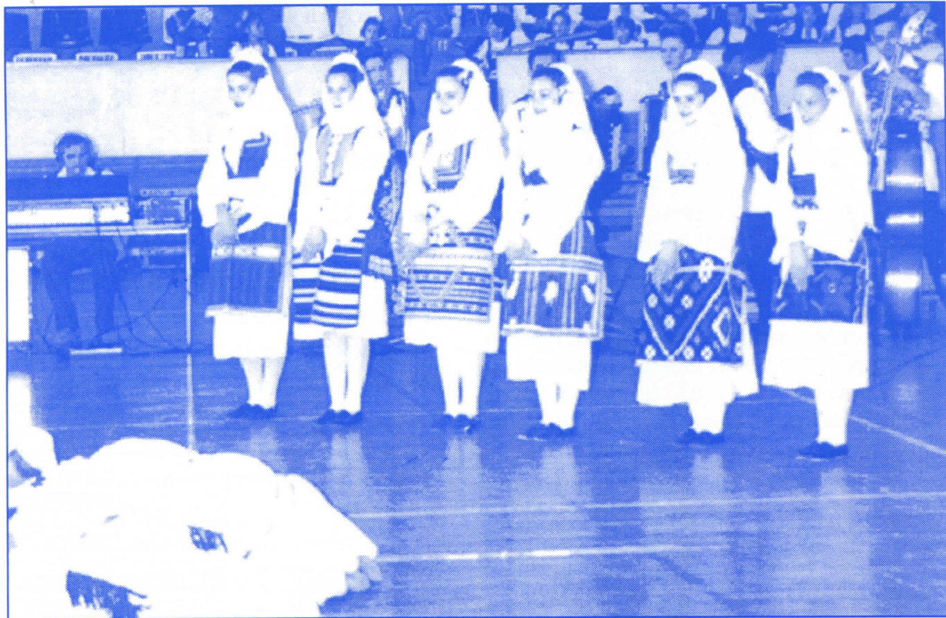
Српски радикали обезбедиће услове за рад свим Културно – уметничким друштвима са територије општине Врачар

Када поклоните своје поверење српским радикалима, ваш нови одборник биће вам увек