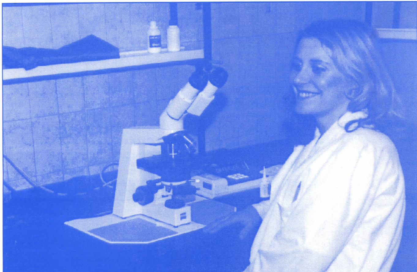
Један од приоритета српских радикала: опремићемо Дом здравља Врачар

Када поклоните своје поверење српским радикалима, ваш нови одборник биће вам увек