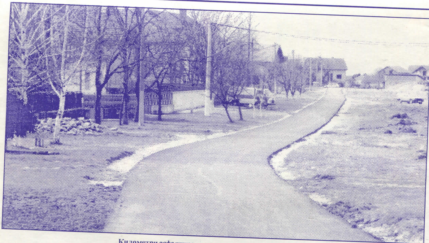
Километри асфалтираних путева у земунској општини

градским структурама, јер одговорност представља фундамент сваке успешне власти. За очекивати је да ће грађани знати да препознају праве вредности.