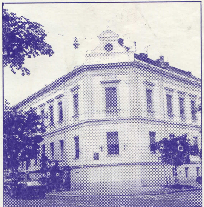
Уређене фасаде у центру Земуне