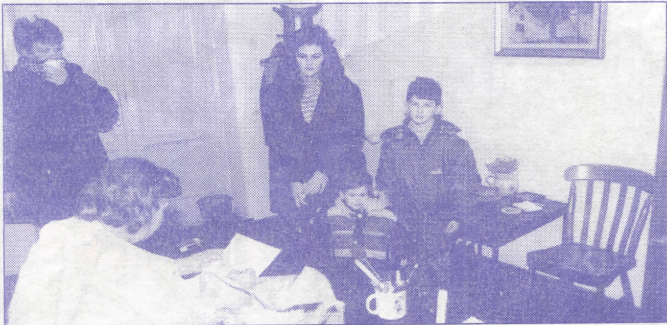
Хуманост на делу: брига о деци палих бораца

Иако је прошло већ доста времена и изречено небројено обећања да ће се тим несрећницима обезбедити адекватни услови за живот, проблем се није покренуо са мртве тачке, а нема назнака да ће доћи до преокрета у последњим данима владавине СПО-а у Раковици. Управо је зато неопходна промена власти да би се великом броју наших суграђана без крова над главом коначно помогло, без обмана и празних обећања.