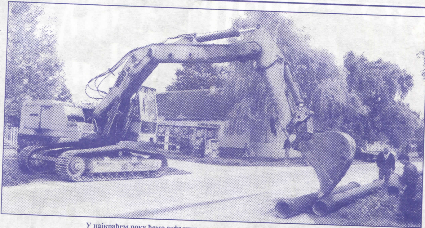
У најкраћем року ћемо асфалтирати и реконструисати улице на Звездари