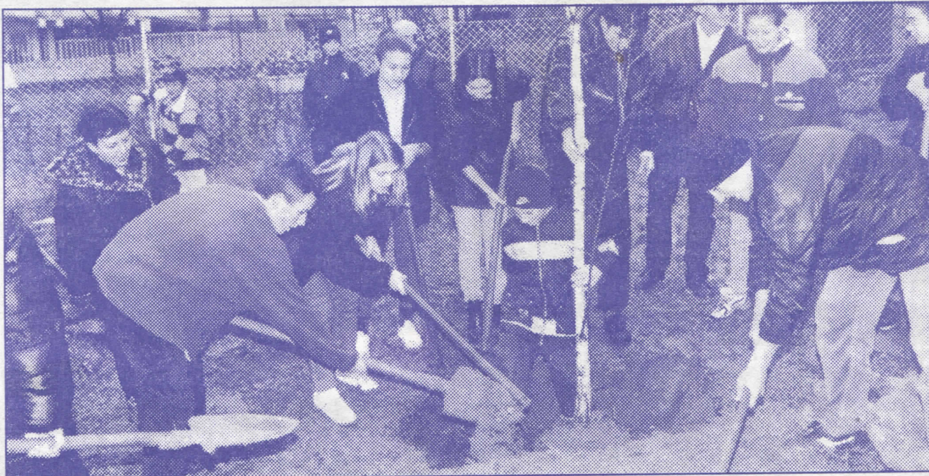
Уређење животне средине