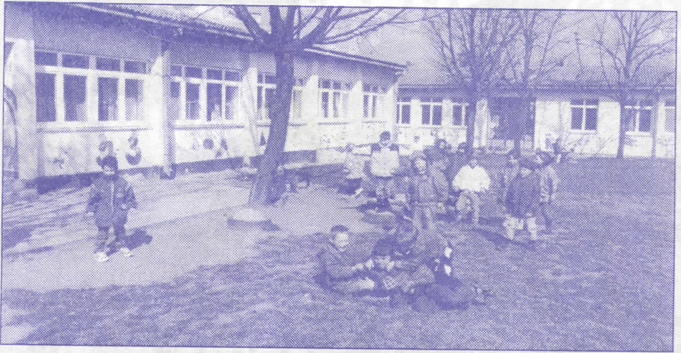
Брига о најмлађима је приоритет