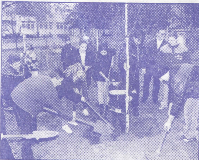
Оплеменавањем зелених површина доприносимо очувању и заштити животне средине

– асфалтираћемо део улице Моме Стевановића од спомен-парка "Црквенац" до касарне ВЈ, улице Ивана Долхара Васе и Милентија Поповића.