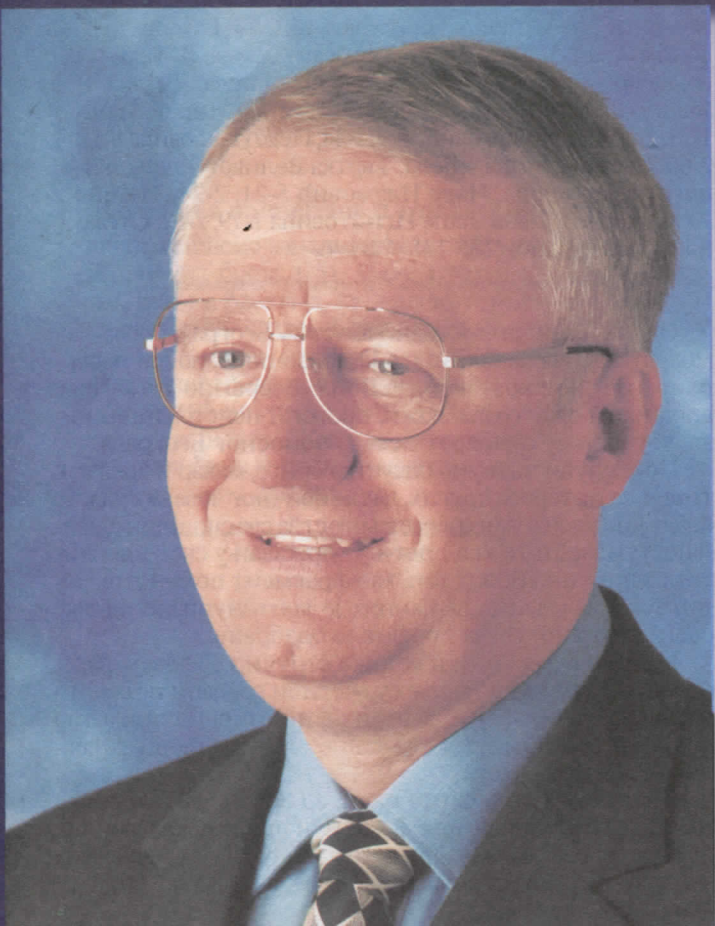
др ВОЈИСЛАВ ШЕШЕЉ ПРЕДСЕДНИК СРПСКЕ РАДИКАЛНЕ СТРАНКЕ