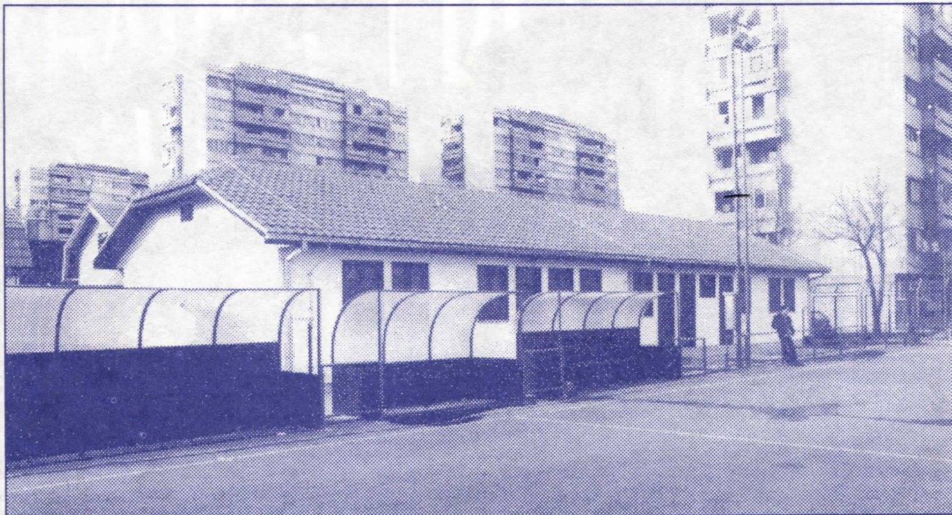
Уредићемо постојеће спортске терене