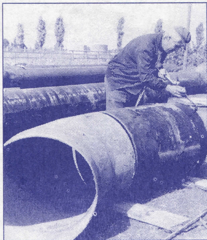
Изградња и одржавање водоводних и канализационих мрежа

– Изградићемо канализациону мрежу у улицама Браће Јерковић од броја 1-51, Пеке Павловића до Душановачке, Ђакон Авакума, Заплањска, др Милоша Пантића, Свете Симића, Лазара Аврамовића, Кнеза Богосава, Лијешка, Селимира Јевтића, Твртка Великог, Бране Ћосића, као и неколико споредних малих улица, – очистићемо запуштену канализациону мрежу у месној заједници ”Жикица Јовановић Шпанац”, – набавићемо и поставити водоводне и канализационе поклопце на шахтовима.