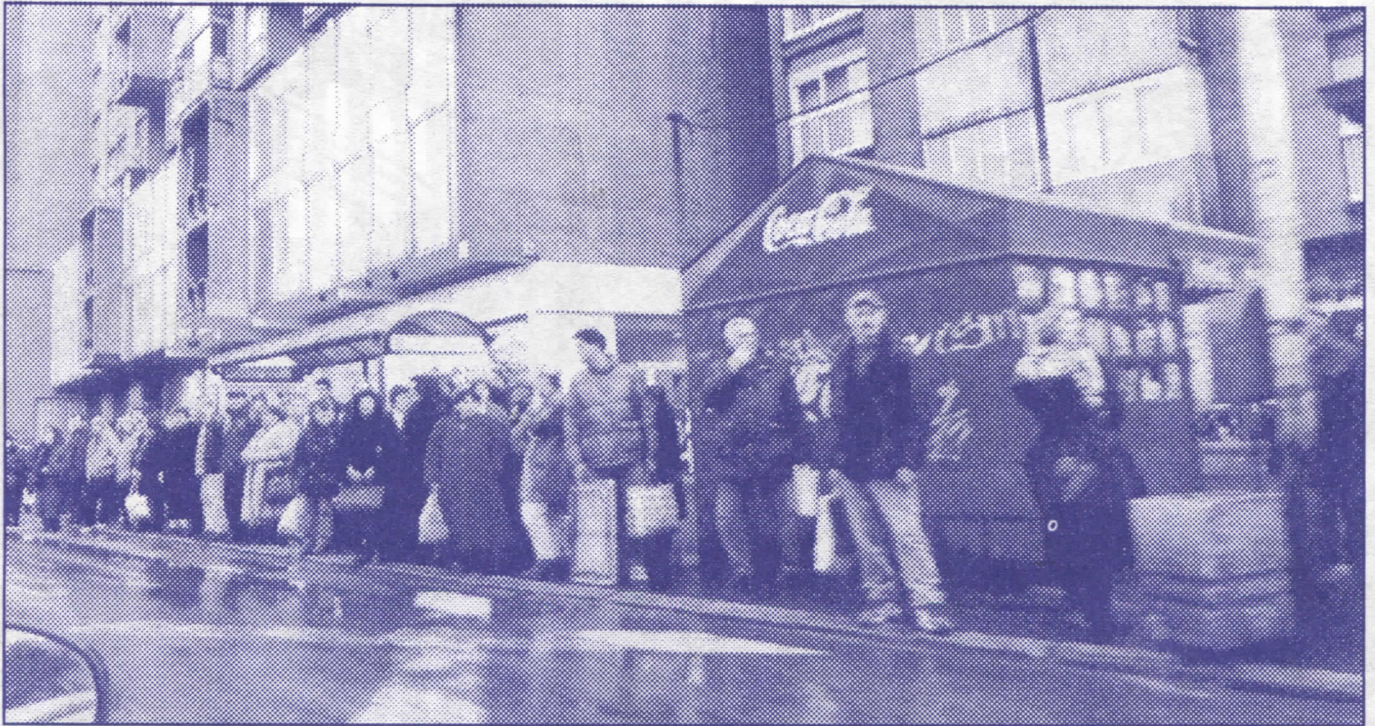
Досадашња градска власт показала је колико им је стало до Београда и Београђана

– у месној заједници ”Дражањ” асфалтираћемо пут Умчари–Дражањ, пут Прокића (и прикључити га код надвожњака Шепшен–Дражањ на аутобуску везу Гроцка–Младеновац), Гробљанску улицу (од Београдске до гробља), у засеоку Роми асфалтираћемо све прилазне путеве,