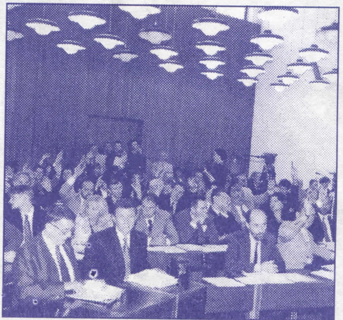
Радикали су за оштру борбу против корупције и криминала

– уз асфалтирање урадићемо и пратеће радове у смислу извођења одводних канала и постављања потребне сигнализације,