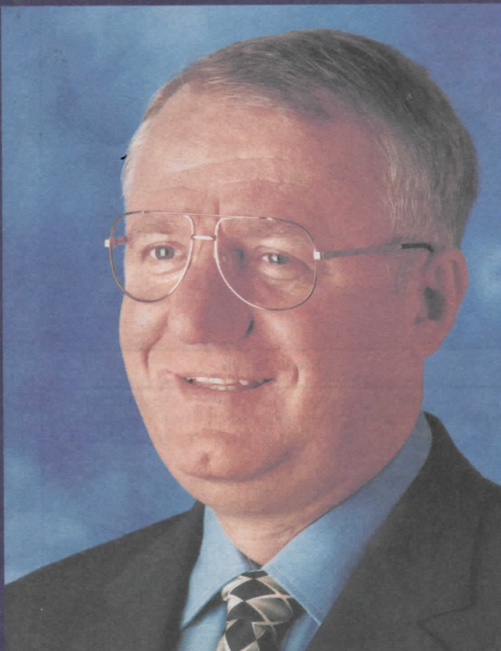
др ВОЈИСЛАВ ШЕШЕЉ ПРЕДСЕДНИК СРПСКЕ РАДИКАЛНЕ СТРАНКЕ