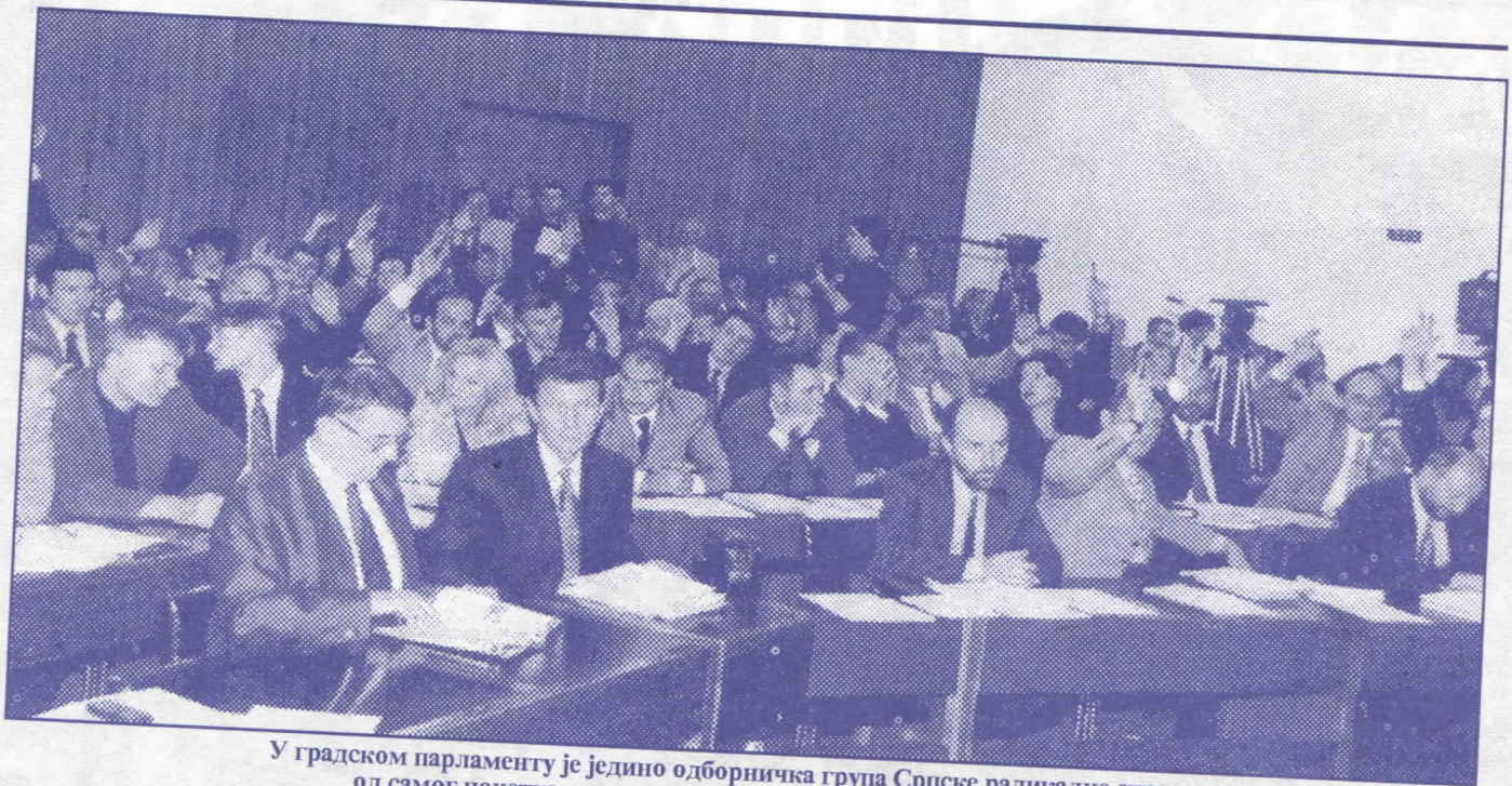
У градском парламенту је једино одборничка група Српске радикалне странке од самог почетка указивала на кршење општих интереса грађана

Гласајте за оне који нису компромитовани и којима је интерес народа изнад свега.