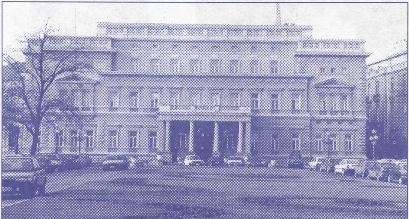
Стари двор: почетак и крај лицемерја Српског покрета обнове