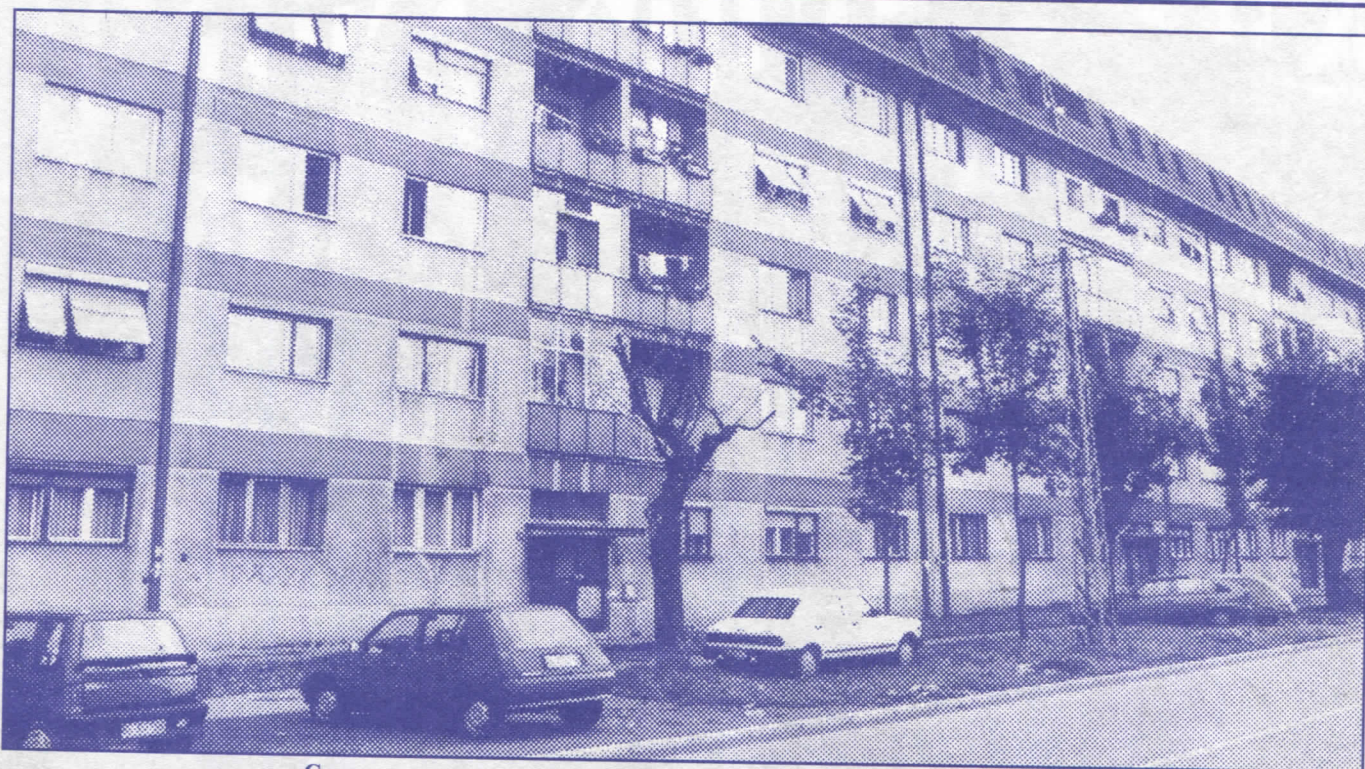
Српска радикална странка је у Земуну омогућила откуп 620 станова, и та средства уложила у изградњу и поправку инфраструктуре

ти ове власти заиста уверени да грађани не виде раскорак између јавно изговорене речи о бољој будућности "када дођемо на власт", и њиховог деловања и понашања.