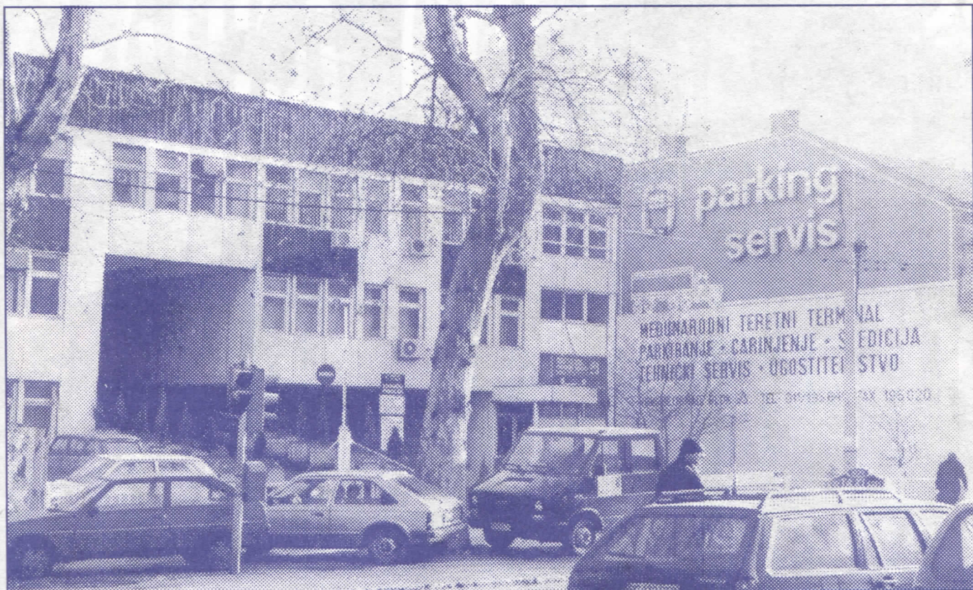
"Паркинг сервис" – сервис за прање новца СПО-а