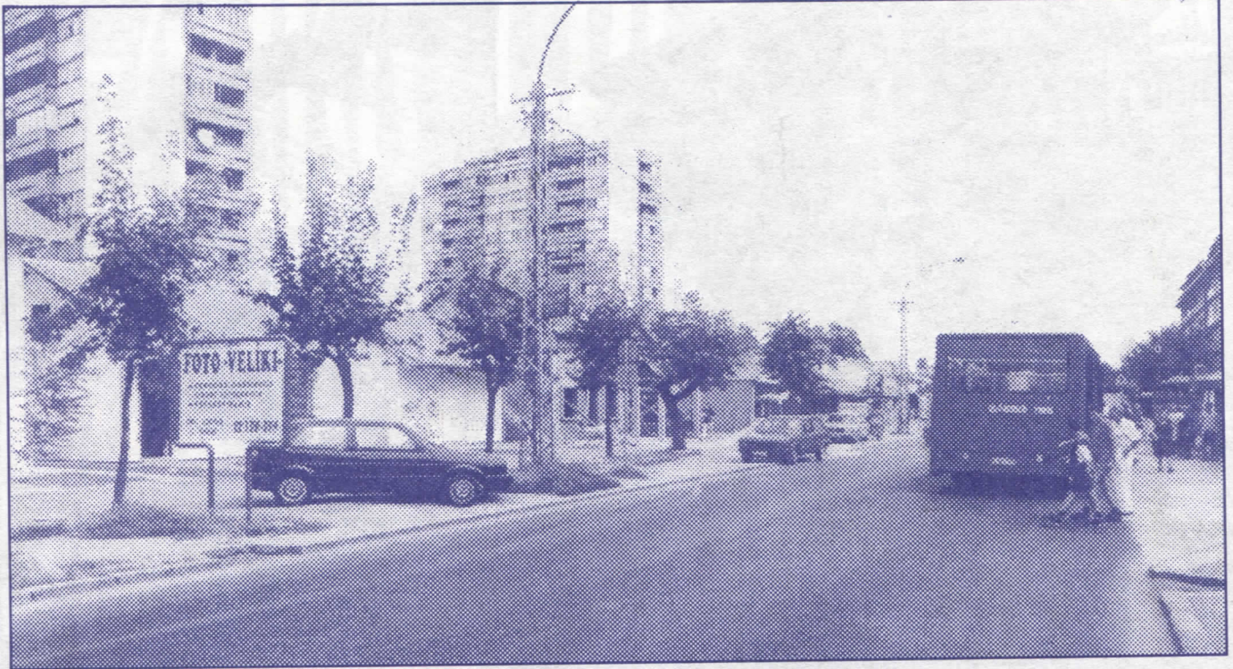
Модерним саобраћајницама – са српским радикалима у 21. век