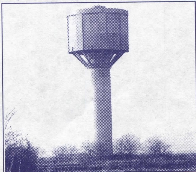
Вода у свако домаћинство: реконструкција и изградња водовода