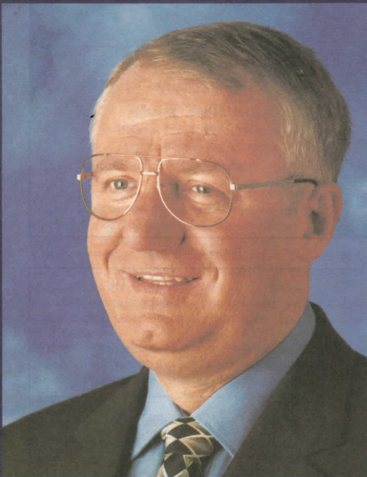
др ВОЈИСЛАВ ШЕШЕЉ ПРЕДСЕДНИК СРПСКЕ РАДИКАЛНЕ СТРАНКЕ