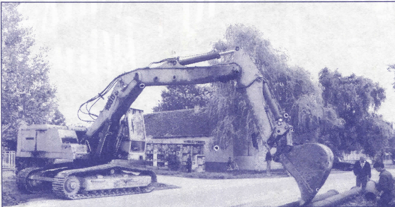
Изградња водоводне и канализационе мреже