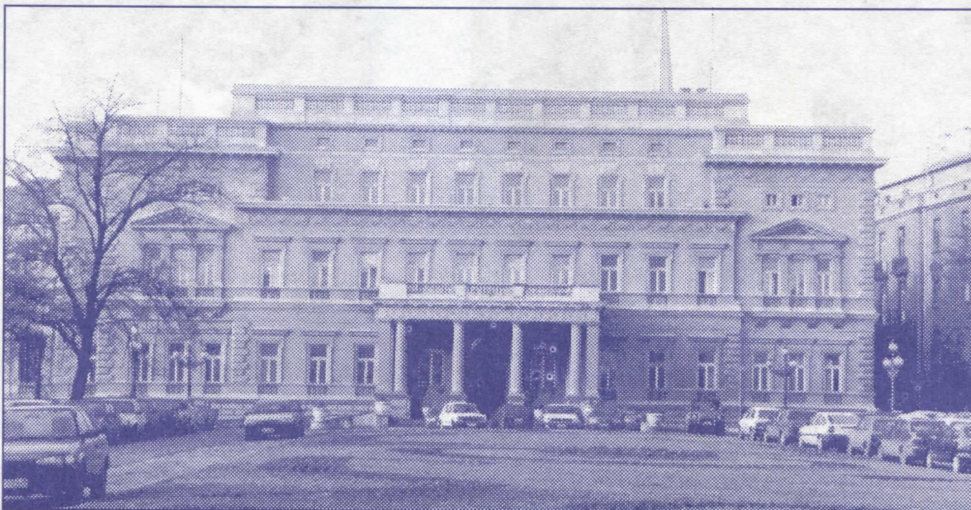
Стародворске сплетке градских функционера највише су коштале грађане Београда