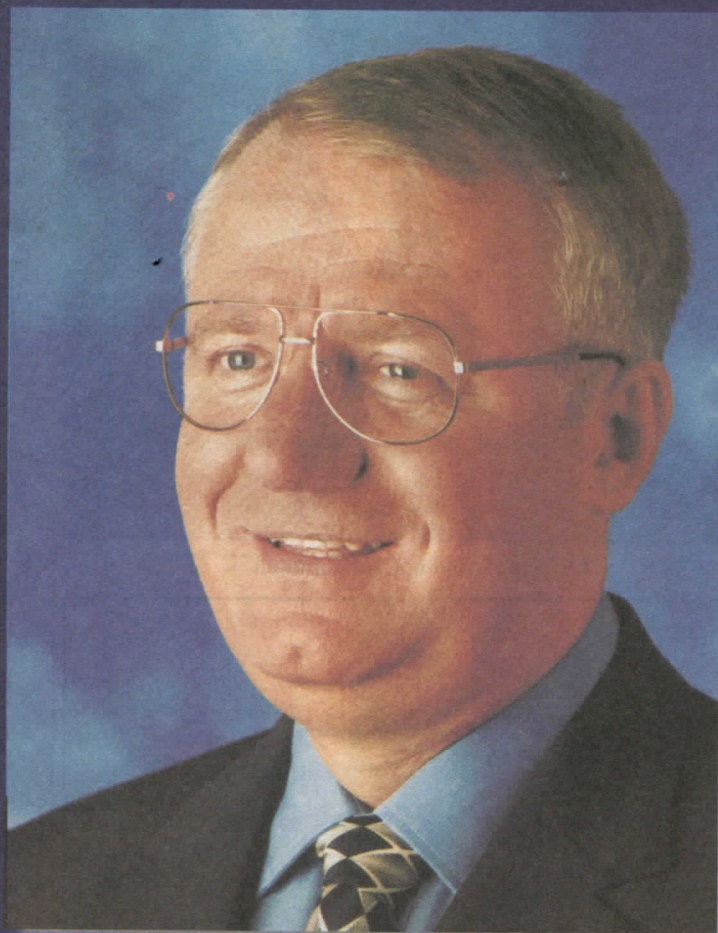
др ВОЈИСЛАВ ШЕШЕЉ ПРЕДСЕДНИК СРПСКЕ РАДИКАЛНЕ СТРАНКЕ