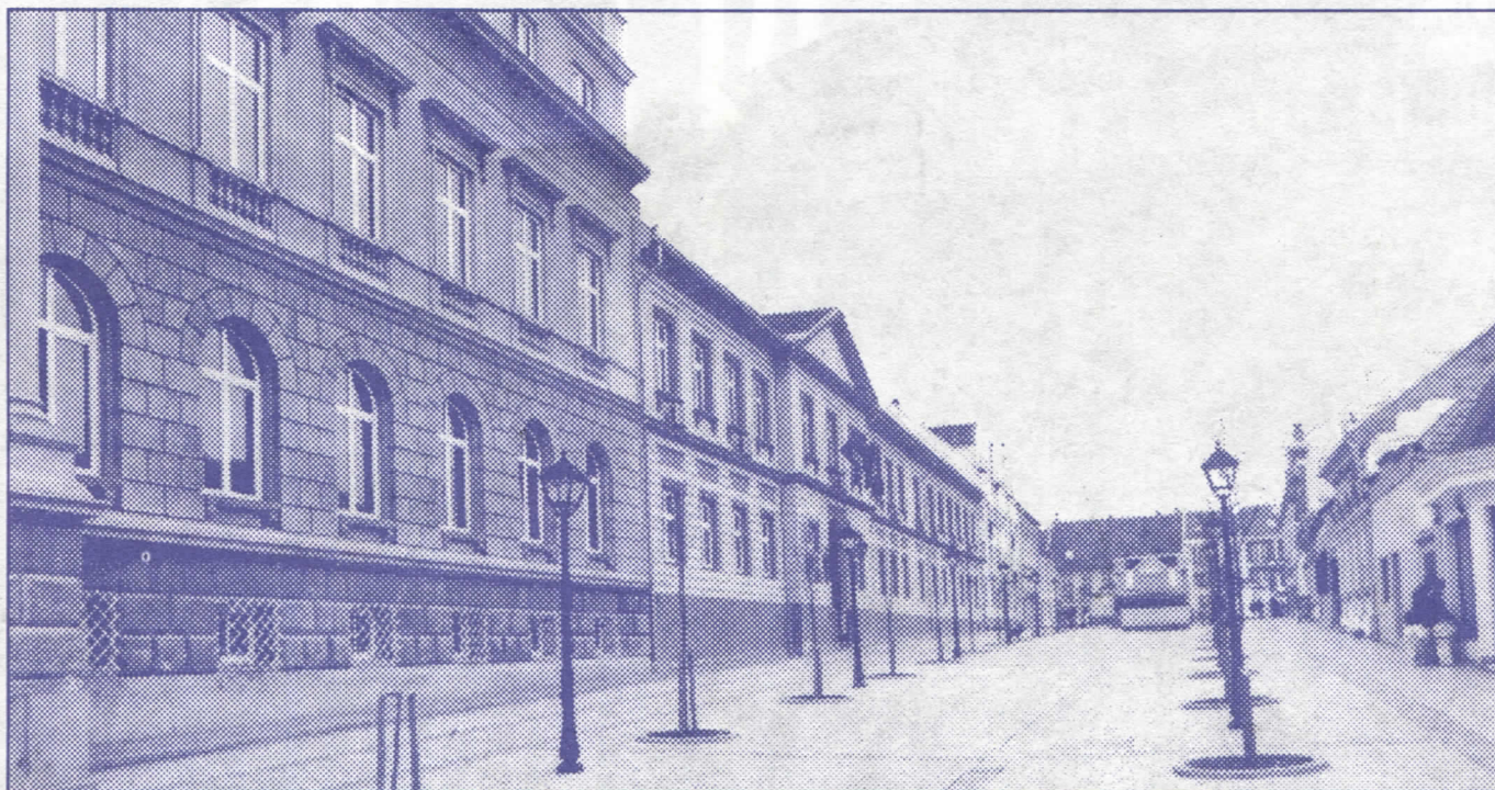
Трг победе српских радикала