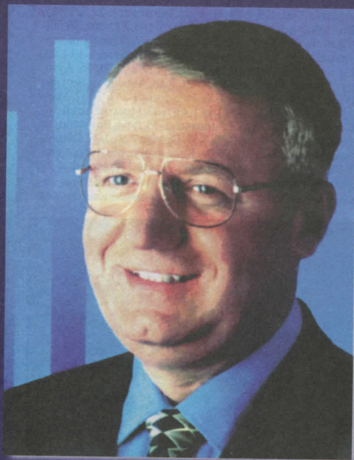
др ВОЈИСЛАВ ШЕШЕЉ ПРЕДСЕДНИК СРПСКЕ РАДИКАЛНЕ СТРАНКЕ