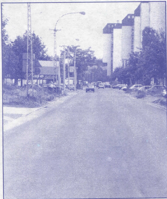
Наставити са асфалтирањем на територији целе општине Земун

У претходном мандатном периоду и сами сте сведоци колико се урадило на територији општине Земун. Настављамо у истом смеру, те ћемо, уколико се