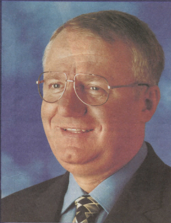
др ВОЈИСЛАВ ШЕШЕЉ ПРЕДСЕДНИК СРПСКЕ РАДИКАЛНЕ СТРАНКЕ