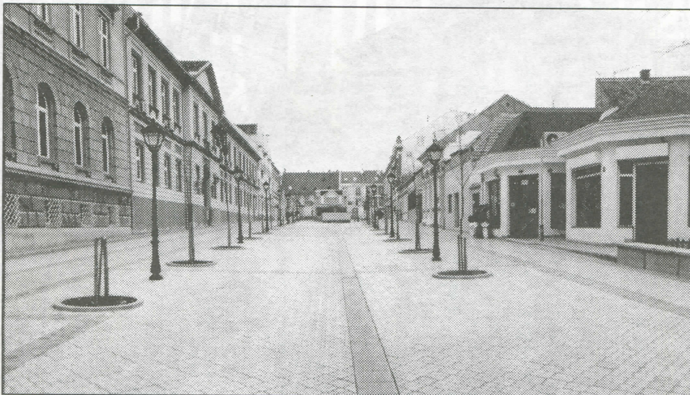
Уређење пешачких зона и уличне расвете

Српска радикална странка је на територији Земунa остварила свој програм у потпуности. Дисциплинована, ефикасна, домаћинска и промишљена власт, која служи интересима грађана, управо су смернице рада српских радикала.