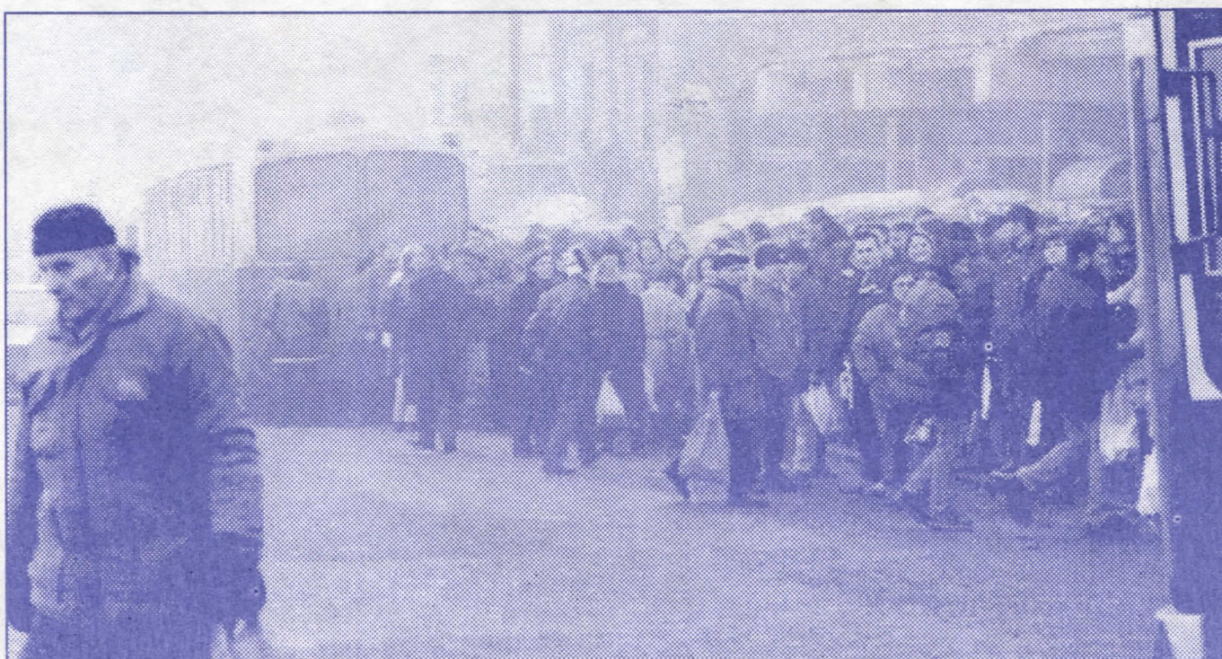
Не поновило се: колапс у саобраћају