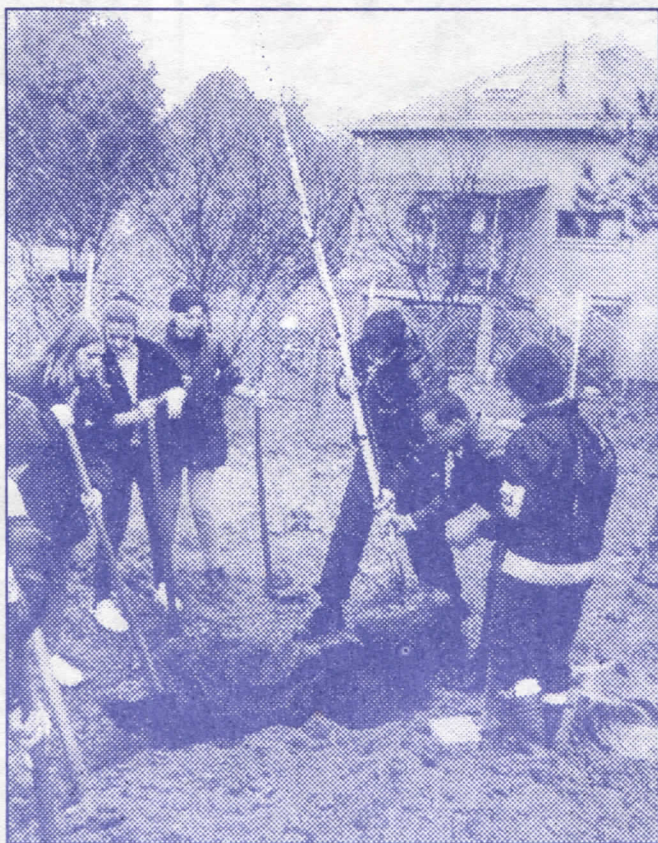
Акција озелењавања у Земуну

– Уредићемо зелене површине дуж улице Бањички венац и парк-шуму дуж Булевара југословенске армије,