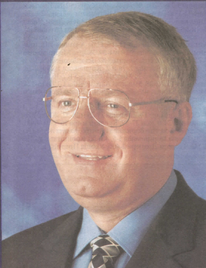
др ВОЈИСЛАВ ШЕШЕЉ ПРЕДСЕДНИК СРПСКЕ РАДИКАЛНЕ СТРАНКЕ