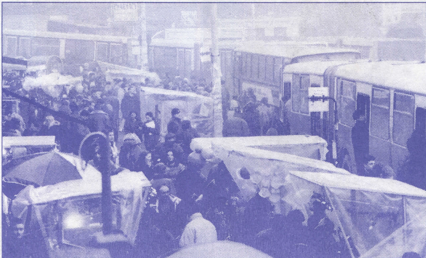
Изградња окретнице на Зеленом венцу

Општинска власт Савског венца, нажалост, није учинила ништа у свом домену посла, већ је ресурсе који су јој остављени на савесно управљање, бесрамно пљачкала и деградирала.