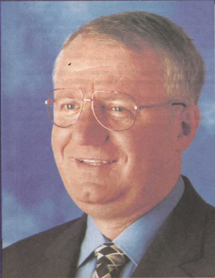
др ВОЈИСЛАВ ШЕШЕЉ ПРЕДСЕДНИК СРПСКЕ РАДИКАЛНЕ СТРАНКЕ