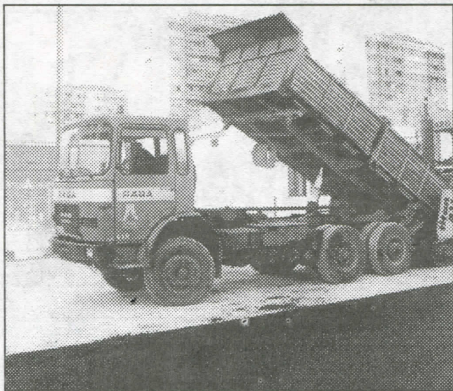
Овако то раде српски радикали

– у Звечкој: посуте су ризлом улице и урађен мокри чвор, као и реновирана кровна конструкција и под у основној школи;