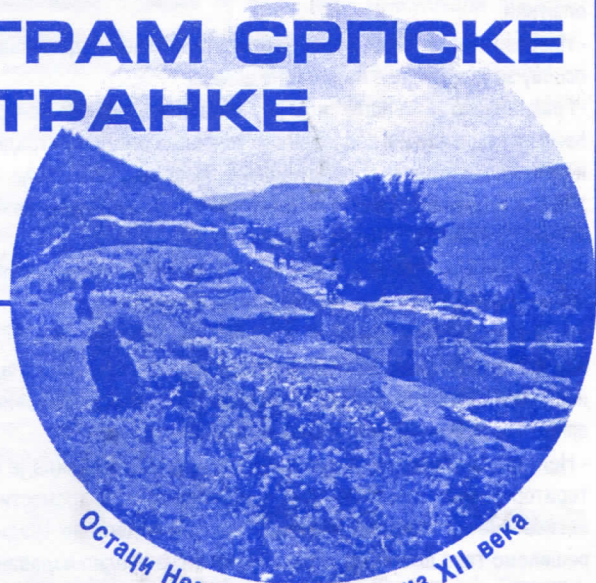
Остаци Немањине државе из XII века

Лоше изведена подела ингеренција и испреплетаност овлашћења између органа локалне самоуправе и државне