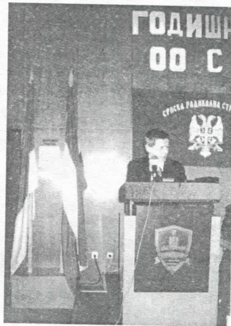
Четврта тачка дневног реда: