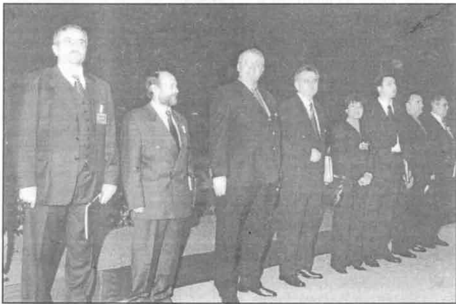
Детаљ са Петог Отаџбинског Конгреса Српске Радикалне Странке