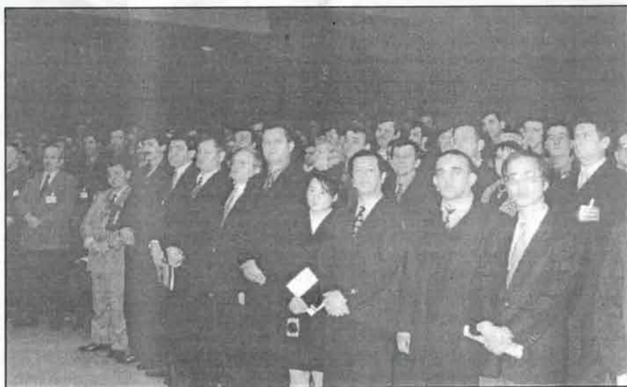
Детаљ са Петог Отаџбинског Конгреса Српске Радикалне Странке

Водитељ: Господине министре, ја предлажем, ако је режија спремна, да кренемо са снимком који је направила телевизија "Палма Плус" на Петом Отаџбинском Конгресу, да видимо атмосферу, да чујемо завршну реч председника Српске радикалне странке, др Шешеља, само да осетимо атмосферу пријема који је, такође, био величанствен у