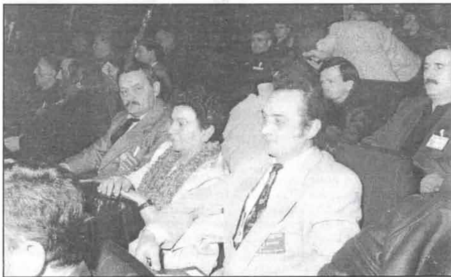
Делегати ОО СРС из Ћуприје на Петом Отаџбинском Конгресу СРС

Марчетић: Ја заиста не знам да ли болница у Ћуприји има грејање. О томе треба да води рачуна