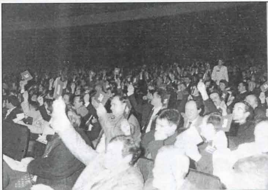
Детаљ са Петог Отаџбинског Конгреса Српске Радикалне Странке

мало маса, морамо да признамо, сад кажу да је чак 17 милијарди динара у оптицају, мало, неко штампа.