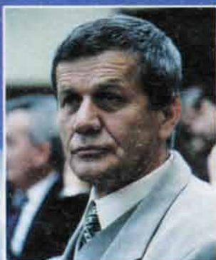
Ратко Марчетић министар за саобраћај и везе у Влади Републике Србије, народни посланик, члан Централне Отаџбинске Управе, председник Окружног одбора СРС Поморавског округа