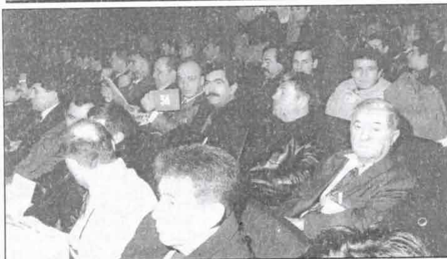
Делегати ОО СРС из Свилајница на Петом Отаџбинском Конгресу СРС

ни". СРС је покушала преко својих посланика да промени ту химну и тражила да то буде "Боже правде", али није имала већину и подршку посланика из других странака.