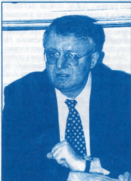
Др Шешелј: „Свака коалициона влада је влада компромиса”

Политичка стабилност у нашој земљи постигнута је захваљујући Републичкој влади. Није било политичких немира, није било политичких сукоба. Имали смо један политички веома стабилан период