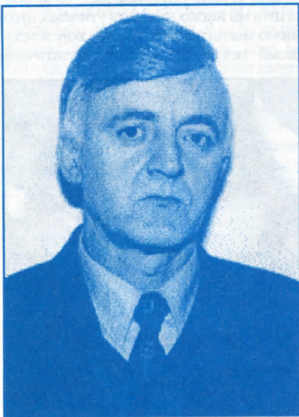
Томислав Пенезић, председник Општинског одбора Прибој, посланик у Републичкој скупштини

У ратним условима све институције система су функционисале чак боље него у мирнодопским и то је основна заслуга владе Републике Србије. Ја сам поносан што ниједан резервиста полиције, а полиција је у надлежности Републичке владе, није остао без иједног ратног додатка и свих оних плаћања.