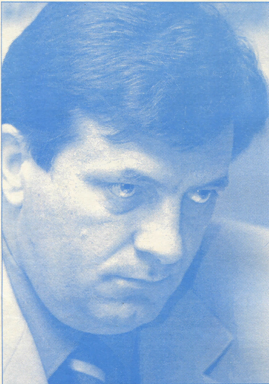
Човек опасних намера: цокер неоколонијалиста Милорад Додик

бодно, политичке партије или друге политичке организације и да се таквим политичким партијама и организацијама пружају нужне законске гаранције које ће им омогућити да се међусобно такмиче на основу једнаког положаја пред законом и пред властима”.