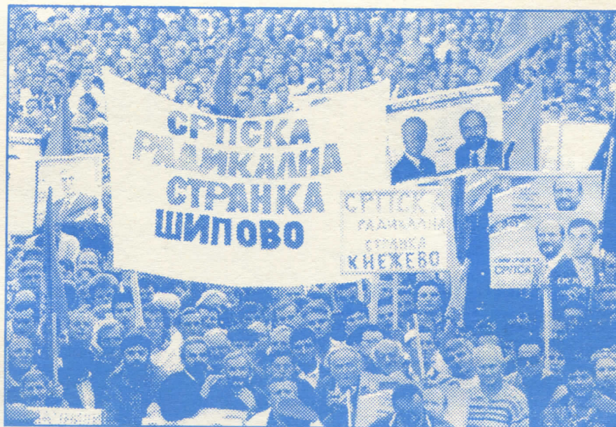
На Дивљем западу ништа ново: неофашисти "демократски" дисквалификовали Српску радикалну странку

Страни интервенционисти желе да и на овим изборима инсталирају послушнике који блокирају развој демократије и либерализацију друштва. Њихов циљ је да Републику Српску утопе у унитарну Босну и Хер-