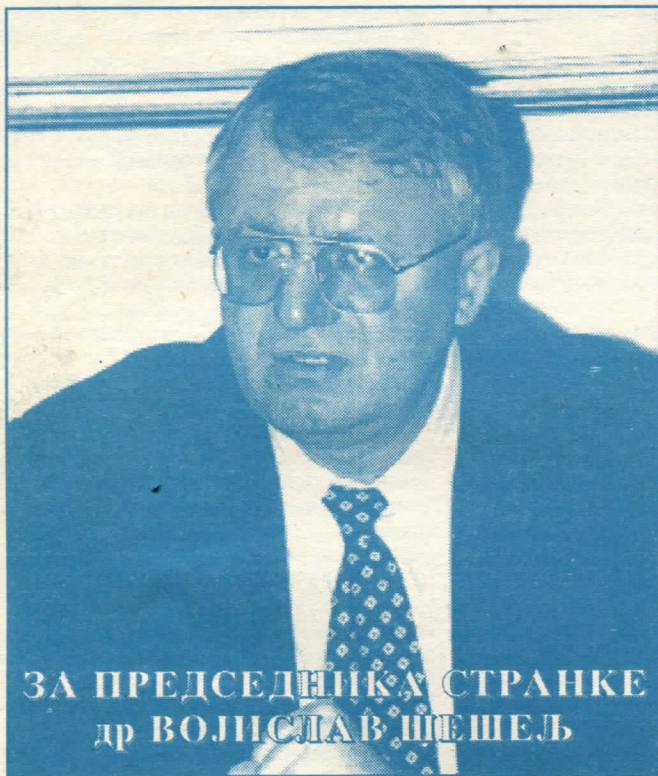
ЗА ПРЕДСЕДНИКА СТРАНКЕ ДР ВОЈИСЛАВ ШЕШЕЉ

МЛАДЕНОВАЦ, ДЕЦЕМБАР 1999. ГОДИНА X БРОЈ 702