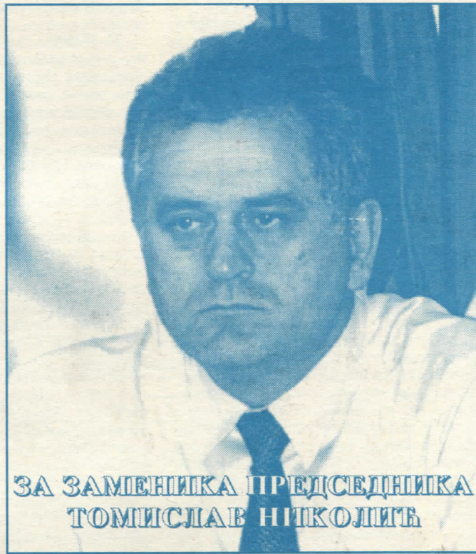
ЗА ЗАМЕНИКА ПРЕДСЕДНИКА ТОМИСЛАВ НИКОЛИЋ