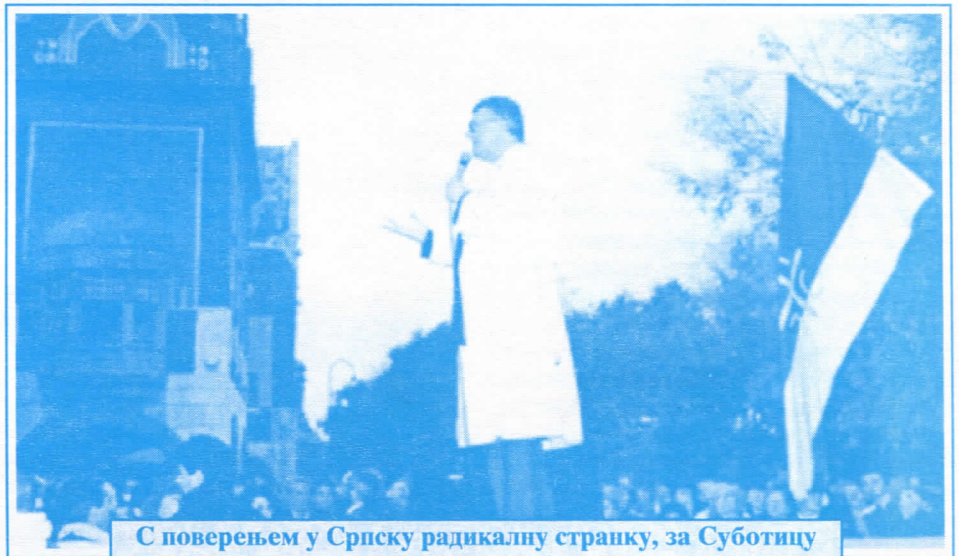
С поверењем у Српску радикалну странку, за Суботицу

Када становници Мале Босне ипак одлуче да се обратe лекару, прво, морају да набаве гумене чизме или каљаче, да би објекту уопште пришли. Такође, морају да пазе како отварају врата, јер би могао да их пресретне део таванице. Ако и ту препреку избегну добро су прошли,