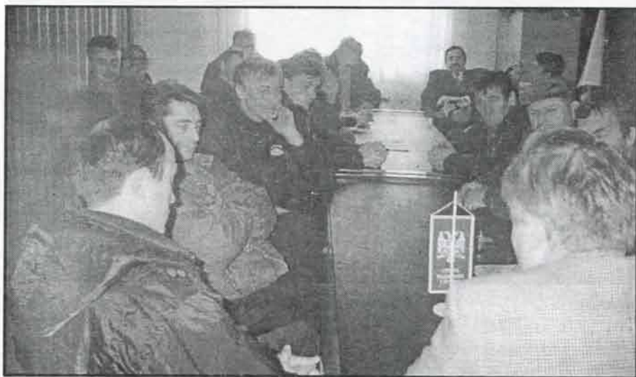
Детаљ са седнице ОО СРС Рековац

ДР ШЕШЕЉ: Ми смо били у дилеми који проблем прво решавати на овај начин, да ли је то проблем пензионера, да ли је то проблем дечијих додатака,