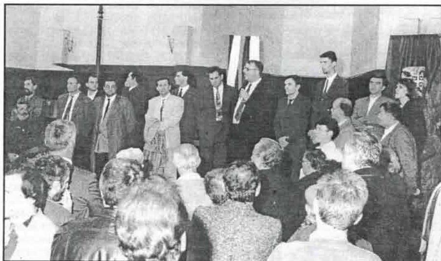
Митинг српских радикала у Свилајнцу