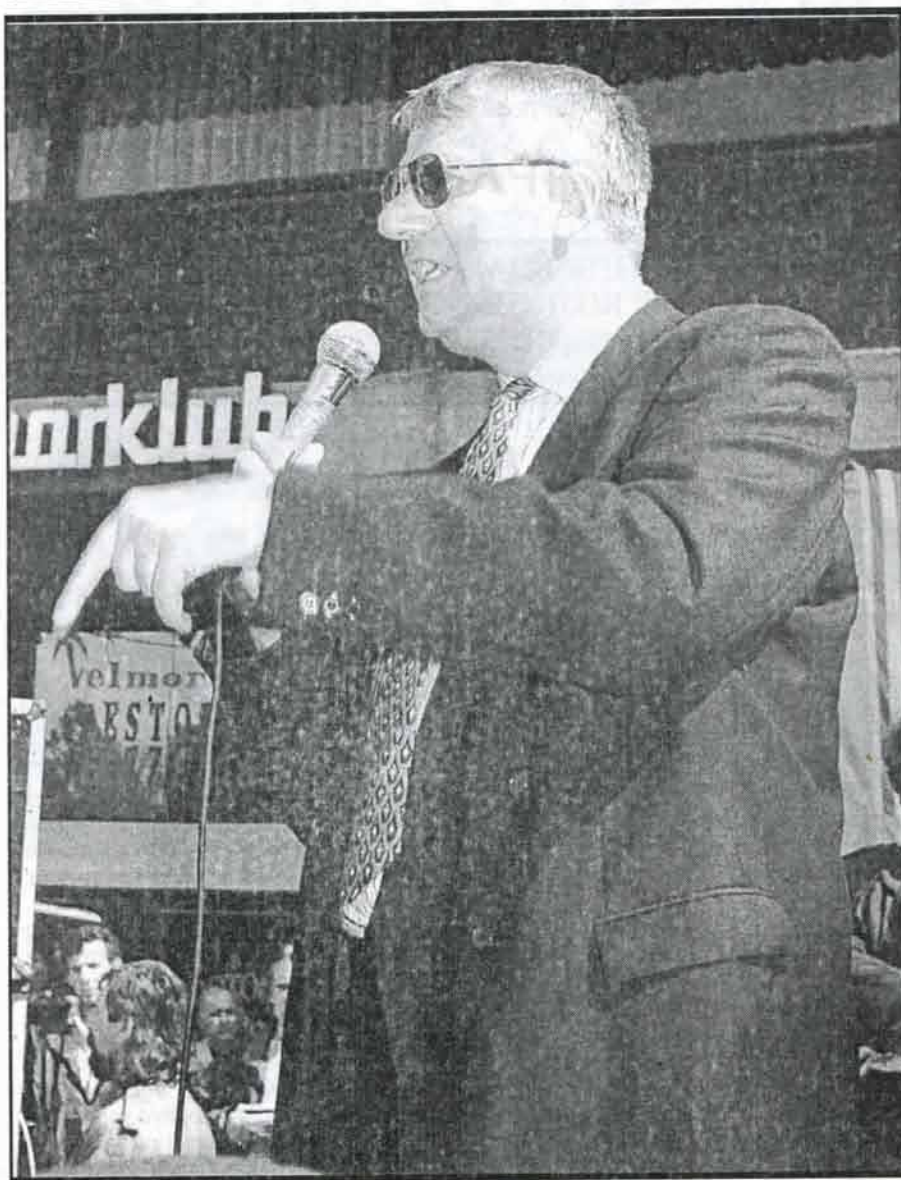
Др Војислав Шешелъ потпредседник Владе Републике Србије председник Српске радикалне странке

прилици већсу почели да се ангажују. Очигледно је шта желе Американци из најава њихових послушника на домаћој политичкој сцени. Видели сте шта говори Ненад Чанак, видели сте шта изјављује Милан Панић. Милан Панић је толика будала да он не зна ни да сакрије, него он тамо негде исприча Мађарима и не зна да ће то допрени и до наше јавности. Суштина је да се Мађарска укључи у решавање српског питања тако што би се Војводина одвојила из Србије и на неки начин припојила Мађарској, уз обећање да ће тако лакше доћи до Европске уније. Не мисле они то башу потпуности да припоје, него да формирају неку везу, опет нешто ново да измисле, што међународно право до сада није познавало. Уколико успеју са отцепљењем Црне Горе, на реду је онда Санџак, а не само србијански део Санџака, него и црногорски, неких десетак општина, дакле, Нови Пазар, Тутин, Сјеница,