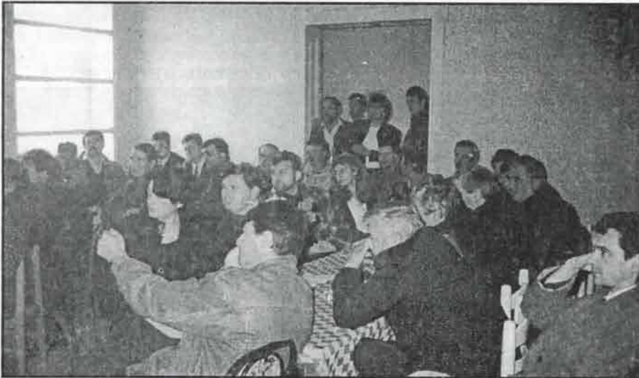
Детаљ са седнице ОО СРС Параћин

ДР ШЕШЕЉ: Дезертери треба да одговарају по закону и ми се немешамо у рад суда. Ту је реч о војном суду. Што се хашпења и издајника тиче, не хapse се неко што је издајник, јер нама у кривичном закону не постоји кривично дело издаје. Постоји сасвим комплетна кривична дела, од одавања тајне непријатељу, прибегавање непријатељу у току рата. Имамо ми неке који су пребегли непријатељу у току рата, јел тако? Е сад зашто се у суду не спроводи таква политика, гоњења, то је друго питање. Што се тиче фашизма, ја нисам овај Савез за промене, ја нисам у целости називао фашистима, имао сам једну емисију недавно на београдској палми, па сам објашњавао сам појам фашизма, па тумачио како фашизам заправо чини фашистичка идеологија, фашистички покрети, фашистички методи деловања. Што се тиче фашистичке идеологије, код нас у српском народу то никада није било изражено. Имали смо у Другом светском рату Љотићевци, али то је био маргилан покрет, без утицаја у ширим народним масама. После 1990. године у неколико странака се то појавило,