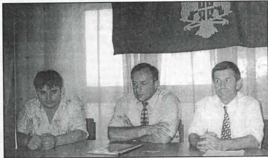
Милован Радовановић, министар за вере у Влади Републике Србије у Деспотовцу

ВОДИТЕЉ: Да ли је тачно да је Србија блокирала проток прехранбених производа према Црној Гори и да је то...?