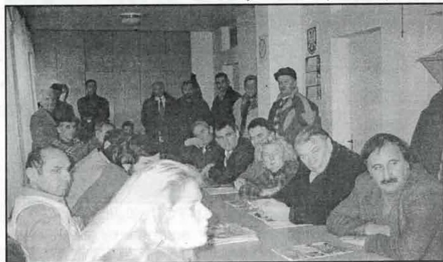
Детаљ са седнице ОО СРС Јагодина

ВОДИТЕЉ: Каже - да се не бавите политиком, да ли бисте могли да издржавате шесточлану породицу у Србији, са платом која би била просечна?