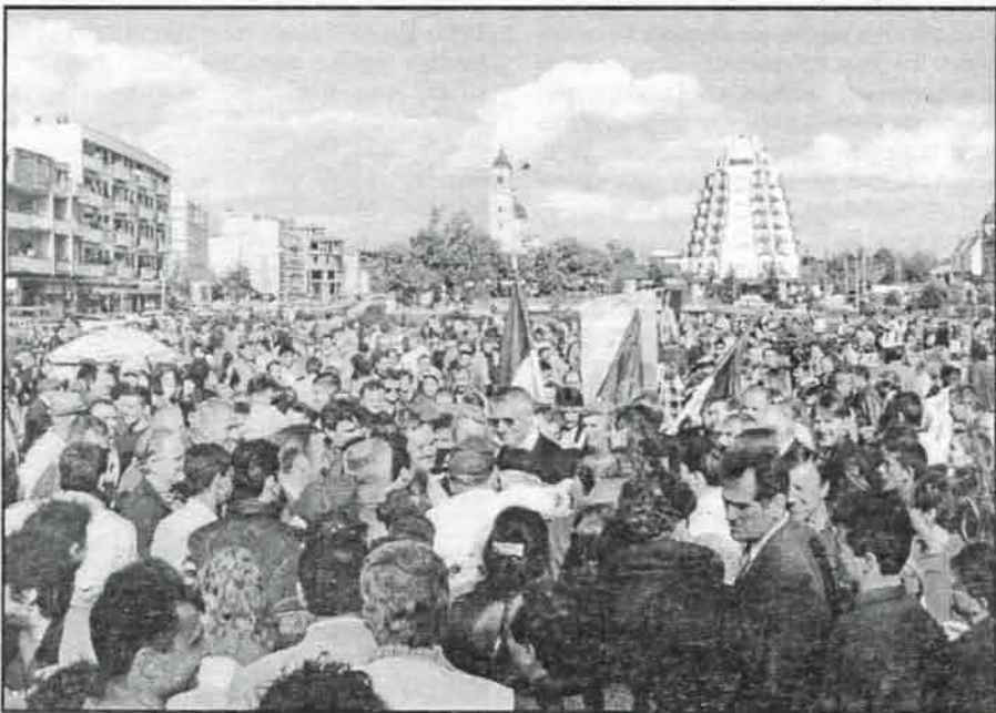
Др Војислав Шешел са грађанима Параћина