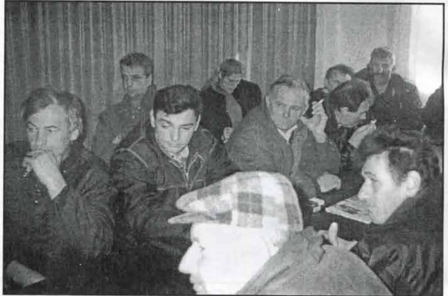
Детаљ са седнице ОО СРС Рековац

ВОДИТЕЉ: Потпредседниче, можемо ли у резимеу да кажемо, шта је задатак Владе Републике Србије у месе-