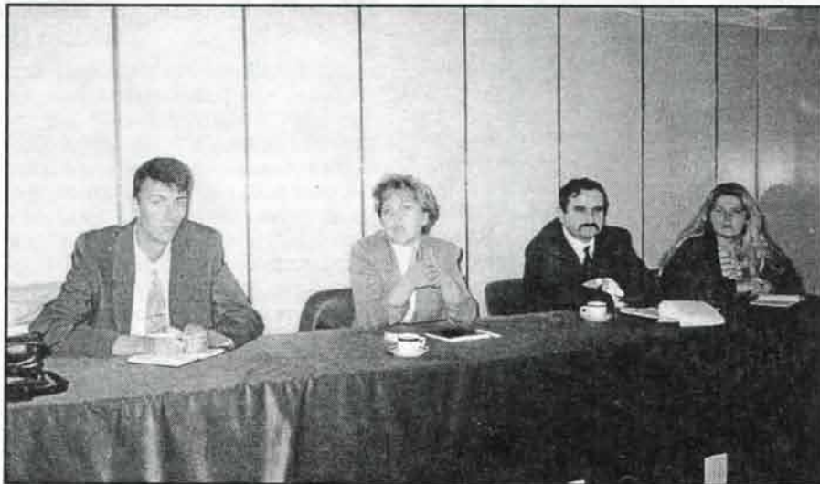
Гордана Поп Лазић, министар за локалну самоуправу у Влади Републике Србије у Јагодини

ДР ШЕШЕЉ: Прво, Ви мене непрекидно питате да ли верујем, да ли верујем у оно. Ја као политичар морам бити оптимиста. Како би то изгледало