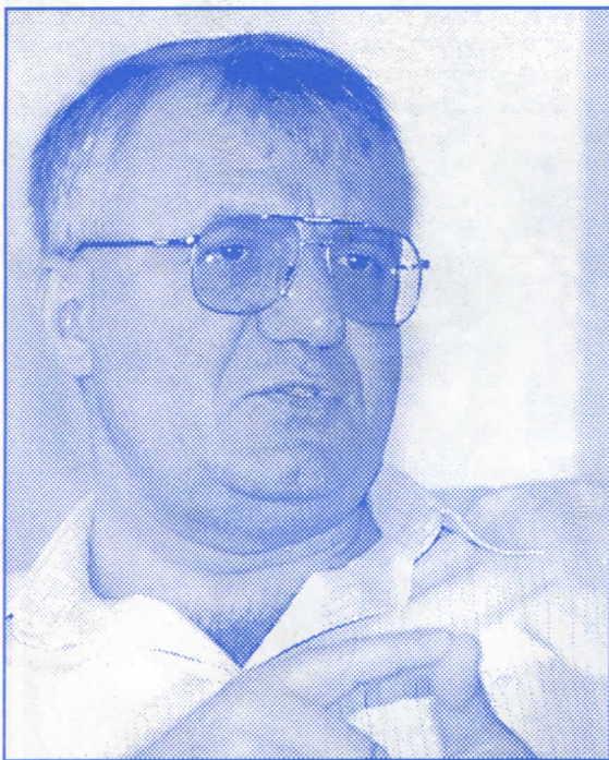
Др Шешел: „Српска радикална странка никада неће одустати од борбе за ослобађање Косова и Метохије”

Сви злочини који су почињени над српским народом учињени су уз благослов Америке и западних сила. Све