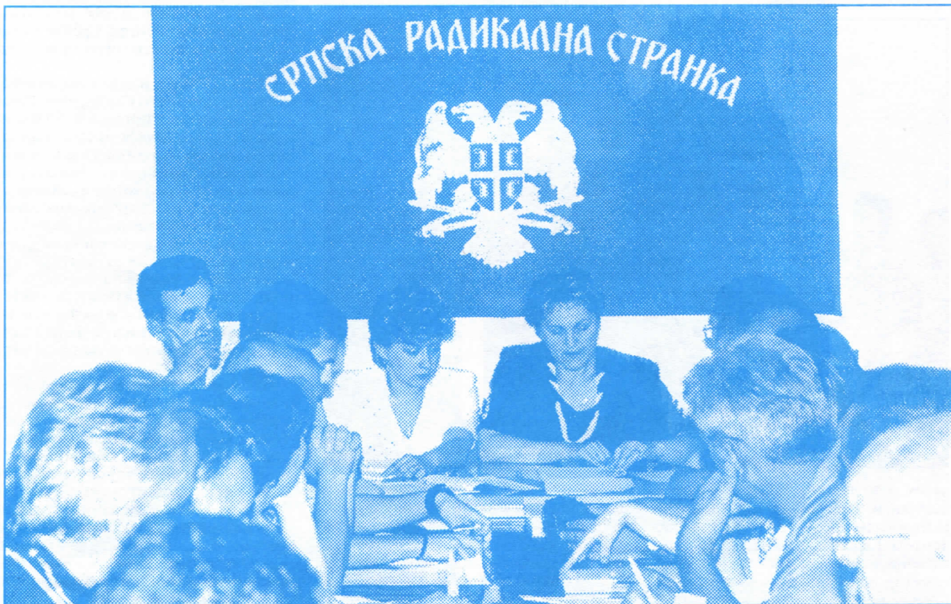
Састанак Општинског одбора: ниједан члан није одбио позив за мобилизацију

... Ми као странка не бежимо од избора, на било ком нивоу. Сматрамо да ти избори треба да иду једним логичким