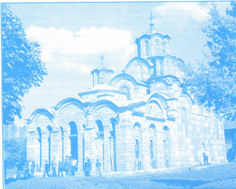
Манастир Грачаница: на мети осветничких банди нашле су се све српске светиње

молитвеника и незаистог жртвеника. Они који су наложили да се план Черномирдин - Ахтисари усвоји, овим чином су аминовали српске жртве из Старог Грачког, Клине, Пећи, Призрена, Баковце, Ораховца, Суве Реке и свих других српских градова претворених у стражишта. Касно је за чуђења и осуде последица, које су сами испровоцирали, жртвујући народ.