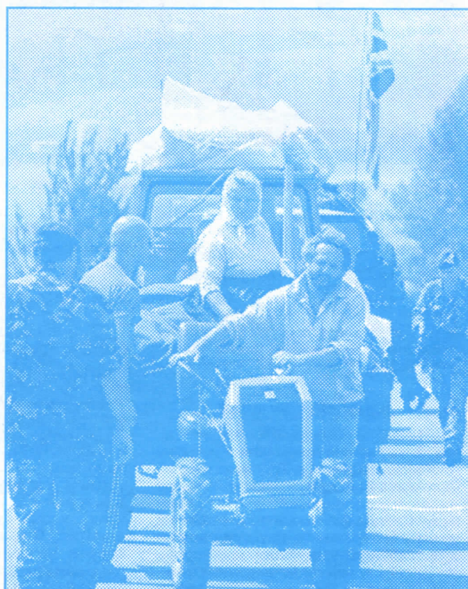
На заједничком послу: Шиптари пале српске куће, а војници КФОР-а пожурују избегличке колоне