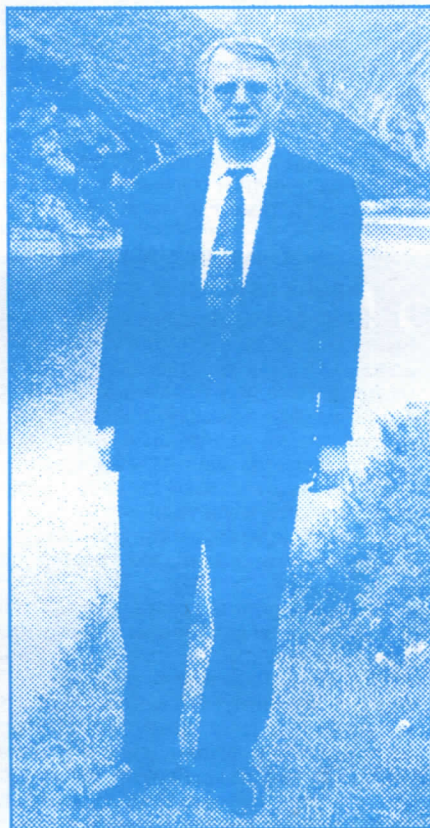
Др Војислав Шешељ: заговорник системских промена

Убеђен сам да ћемо те изборе имати пре коначног рока за њихово одржавање. Ми смо за то да се већ ове јесени одрже локални, да се на пролеће следеће године држе савезни избори и у јесен следеће године да се држе републички избори. То је, мислим, добро за све политичке партије, дакле да се опроба снага, па и ако се и направи нека грешка има могућности за исправку на следећем изборном турнусу. Да се мало тај наш политички живот интензификује како би се каналисао кроз институције система, како се не би водио на улицама кроз уличне немире, а већ постоје извесне тенденције у великој мери потенциране споља. Не само споља, наравно има много унутрашњих проблема и великог незадовољства у народу. То је погодно тло за разне демагошке пароле и за подстицање субверзивних активности са Запада.