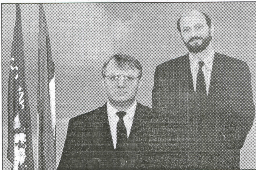
др Војислав Шешељ и др Никола Поплашен

Наиме, Хрвати траже да граница не иде реком Уном како је одређено Дејтонским мировним споразумом већ да иде каналом Унчица који одваја од Републике Српске велики део општине Српска Костајница - Стари Град, а потом се наставља на пет километара дугачак појас током реке Уне.