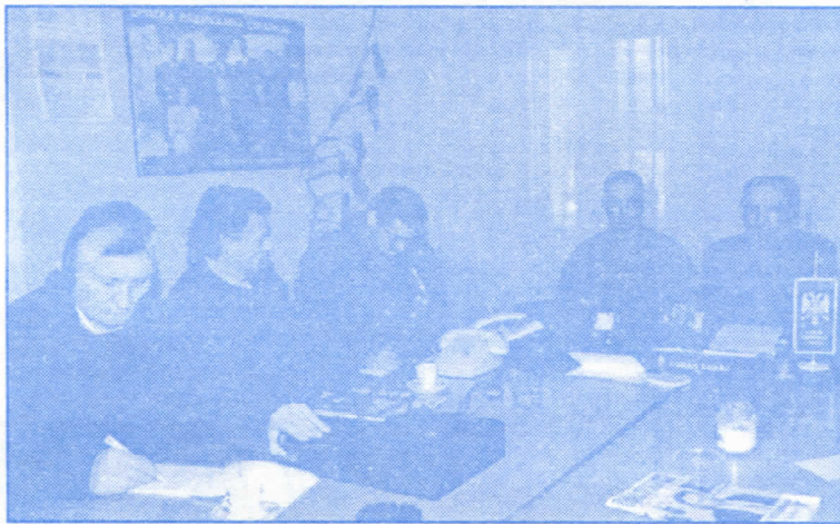
Са конференције за штампу у Шапцу

Тиосавић: – То само говори да Влада ослушкује реаговање народа и да је укидањем овог закона благовремено избрла из руку адуте Српском покрету обнове који је на тој основи хтео да убере који политички поен у народу. Наглашавам да је Закон био добар, али да није можда донет у одговарајуће време.