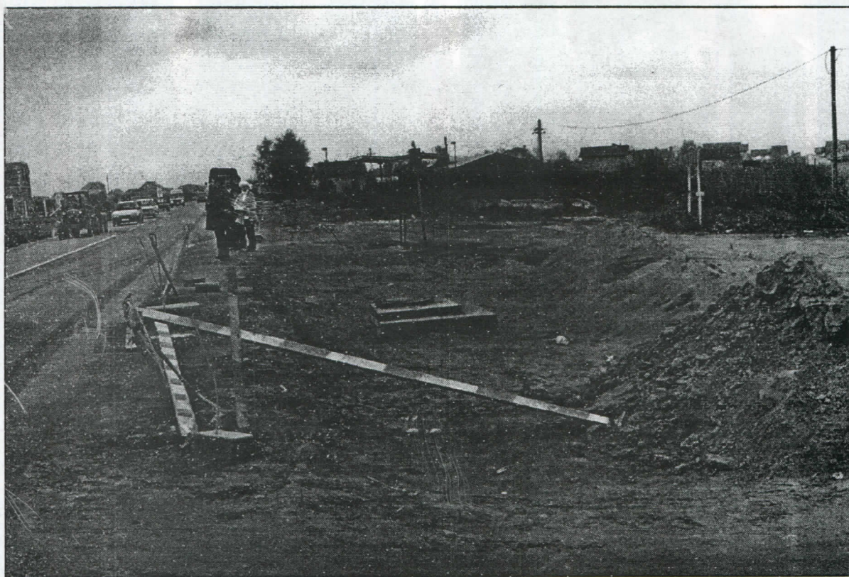
МЗ Футог: прва етапа радова пре рока урађена