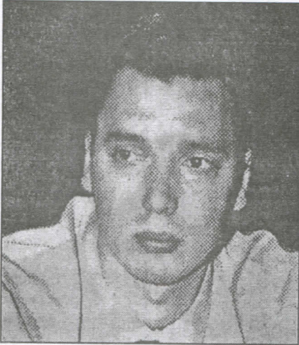
Александар Вучић министар информација