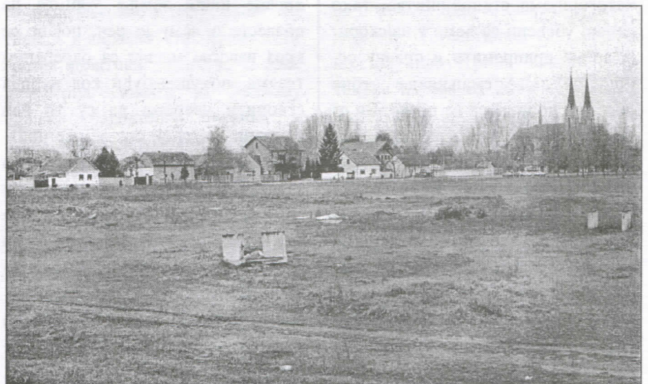
Терен за спортски центар