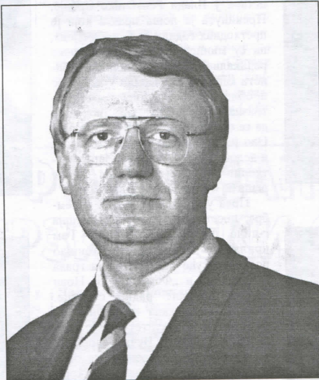
Др Војислав Шешељ

Није њима циљ да се нађе решење, него да увек имају неку основу за притиске против Србије, за сталне уцене, за сталне претње. То је оно