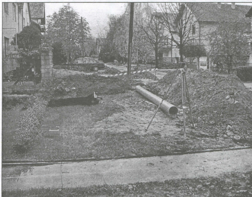
Ово нису лажна обећања

нке, јесте изградња спортског центра. Будући да Футог има значајан број спортских клубова (око 3.000 активних спортиста) који немају