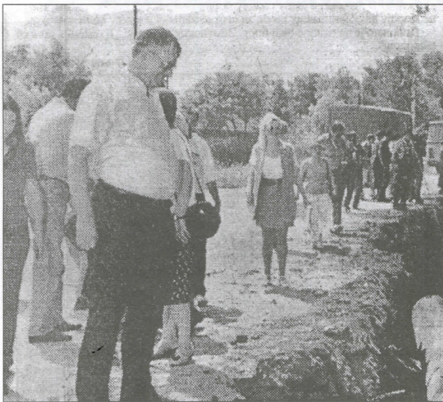
МЗ Футог: Земун као инспирација

Следећа приоритетна инвестиција коју је одредио Месни одбор Месне заједнице, а такође на иницијативу Српске радикалне стра-