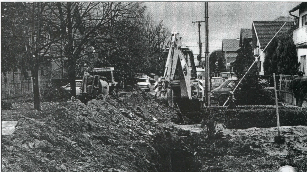
Вишегодишња тежња футожана добила је своје практично отелотворење кроз конкретну изградњу 2,5 км секу- надарне канализационе мреже