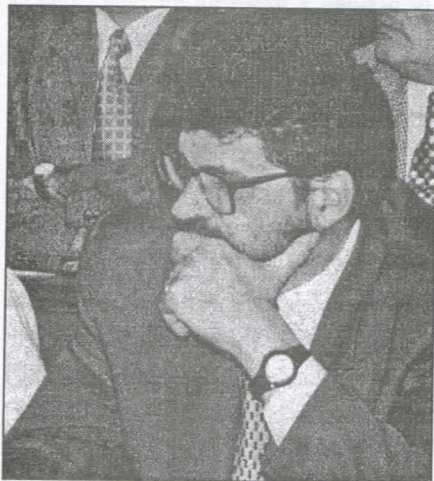
Зоран Красић министар трговине

На позив Градског одбора Српске радикалне странке Нови Сад су у протеклом периоду посетили министри и заменици министара у Влади Републике Србије. Прекинута је лоша пракса која је претходних година била уобичајена, па су министри из редова Српске радикалне странке изашли из кабинета како би се уверили у актуелне проблеме. Посете нису биле куртоазне, већ радне и садржајне, тако да се очекује позитивна рефлексивна. Ово је једини исправан метод рада и деловања министарства, јер се актуелна проблематика не може решити путем саопштења.