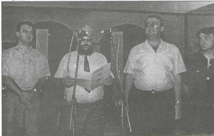
Футог је увек био за радикалне промене