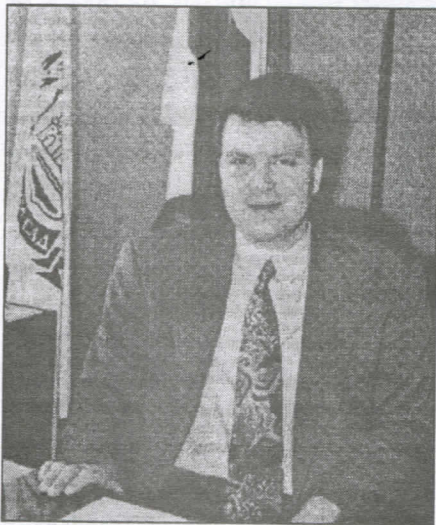
Игор Мировић заменик министра финансија