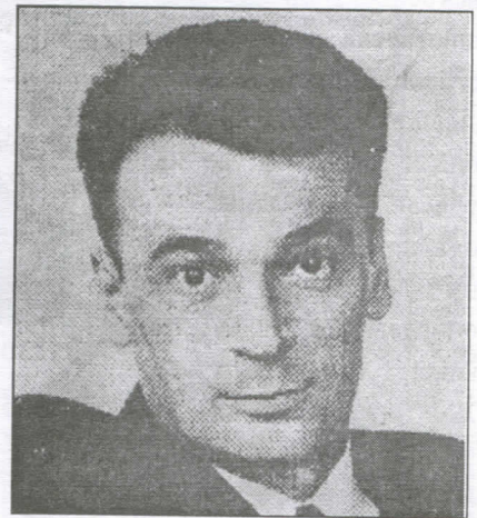
Милорад Мирчић министар за Србе ван Србије