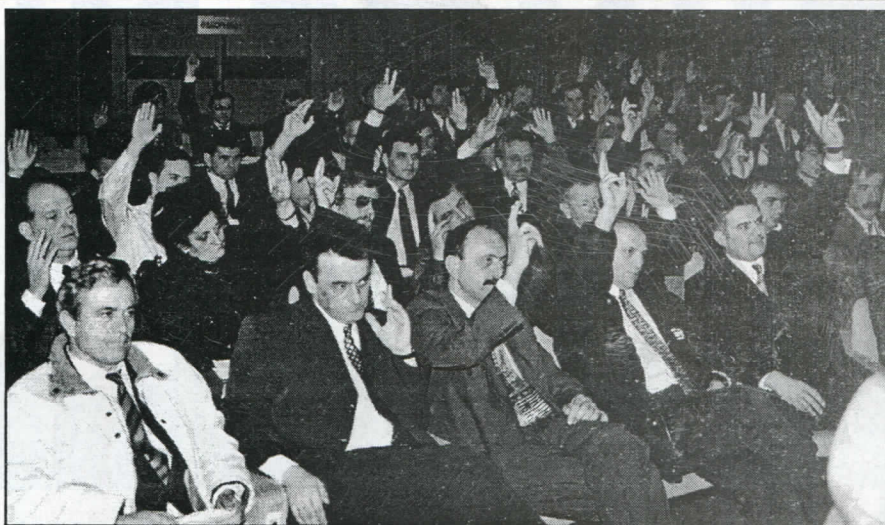
Усвајање закључка: 1000 нових чланова у току 1998. године