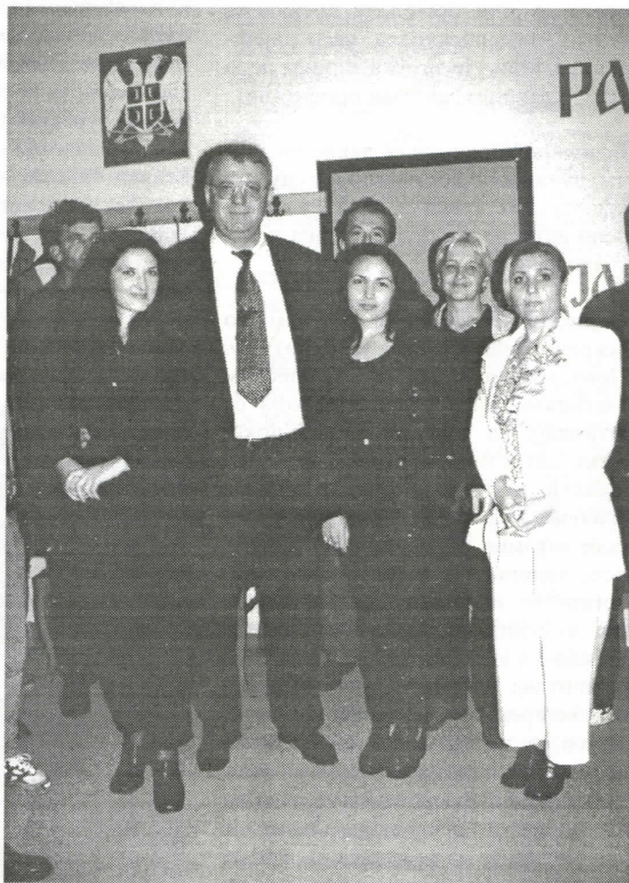
Др Војислав Шешел са члановима Ойштинског Одбора СРС Лесковац

Војислав Шешел: Па боље је и не читати тај "Дневни телеграф", сад више и не може да се чита и кад би неко хтео. Откад траје овај наш обрачун са терористима на Косову и Метохији "Данас" и "Наша борба" држе страну шиптарским терористима. Они их називају, ту терористичку организацију, ослободилачком војском Косова. Крупним насловима објављују, Српска полиција ликвидирала целу једну шиптарску породицу, убијена деца, убијени родитељи, ви нигде не можете да нађете доказе за тако нешто. Учествовали су у правом пропагандном рату против наше земље. То смо спречили, ми нисмо спречили критику Владе, ми нисмо спречили критику политичара. Могу до миле воље да нас