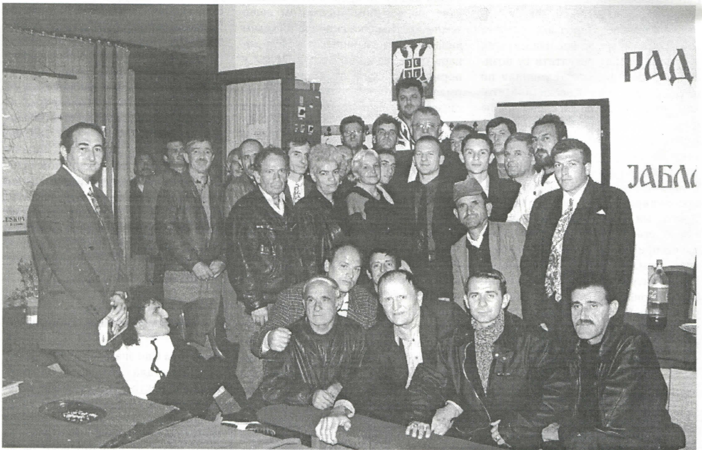
Др Војислав Шешељ са члановима Општинског Одбора СРС. Лесковац

Гледате да што мање попустите. Ја мислим да је наше попуштање било минимално са аспекта оне опасности која нам је претила. Затим, пристали смо да један страни авион лети над територијом Косова и Метохије. У једном тренутку, највише један да буде у ваздуху и да он осматра и снима ситуацију на терену. Али, неборбени авион, авион без наоружања, авион који се не користи у борбене сврхе. Тако да нам није то неки нарочито значајан уступак. Они и тако и тако снимају из сателита из АВАКСА, још са територије Албаније или са територије Македоније и тако даље. Није то нешто што је нама проблематично. Ово што објављује "Кохадиторе" и што су објављивали неки издајнички медији у Београду, управо ове које смо забранили, било је срачунато за вршење психолошког притиска и на Владу Србије и на целокупан народ, на све грађане Србије. Они су објављивали радне верзије америчких планова као да је то нешто што је већ завршено. Ни једна та радна верзија нигде није довршавана нити је било где прихватана. Ми смо пристали да