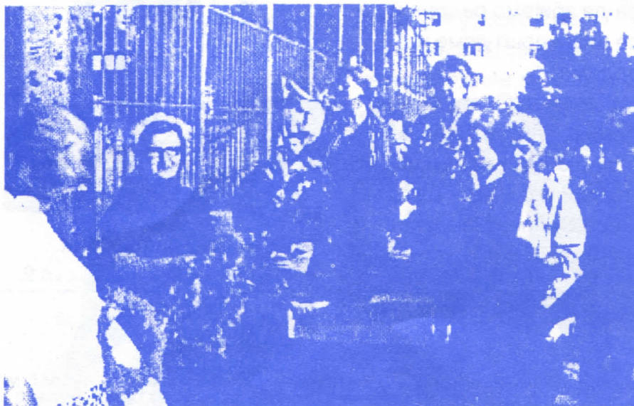
Чланице Кола Српских сестара

Светковине и обичаји око Ивањдана спадају у ред најживописнијих.