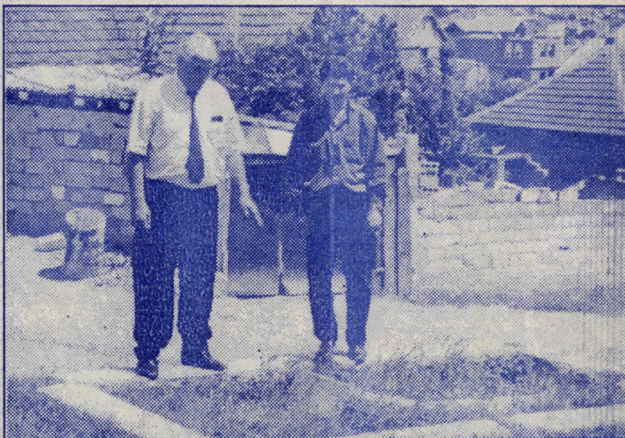
Српски радикали поштоваоци националне историје и традиције

време обреда комите су примећене. Сељани су реаговали крајње позитивно, па су решили и они нечим да помогну комите, отишли су својим кућама и донели храну и пиће.