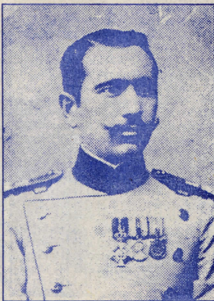
Општински одбор Српске радикалне странке Гњилане обнавља порушени Споменик војводи Драгољубу Николићу