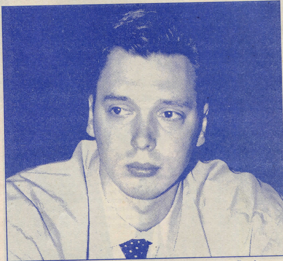
Генерални секретар Српске радикалне странке Александар Вучић: Чврсто смо стали у одбрану српских интереса

Очигледно је да албанске политичке партије координишу своје политичке активности са настојањима западних сила. То су три крила из те завере - НАТО пакт, албанске политичке партије и албанске терористичке организације. Албанске политичке партије и