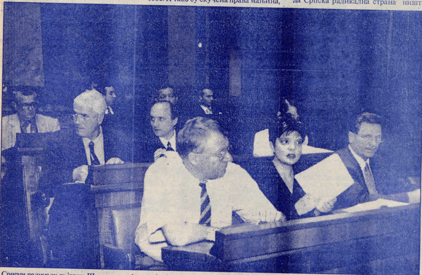
Српски радикали су јасни: Шиптари имају само један избор, да одложе оружје и мржњу и да покушају да се договоре са Србима

Ја и даље тврдим како су криви неки други који су до сада били на власти, а ја да ништа не урадим, односно да Српска радикална страна ништа