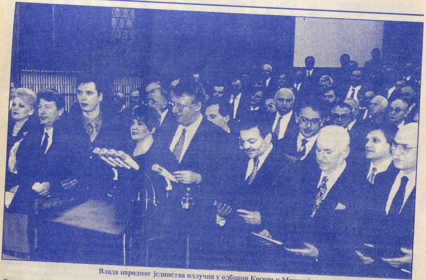
Влада народног јединства одлучна у одбрани Косова и Метохије