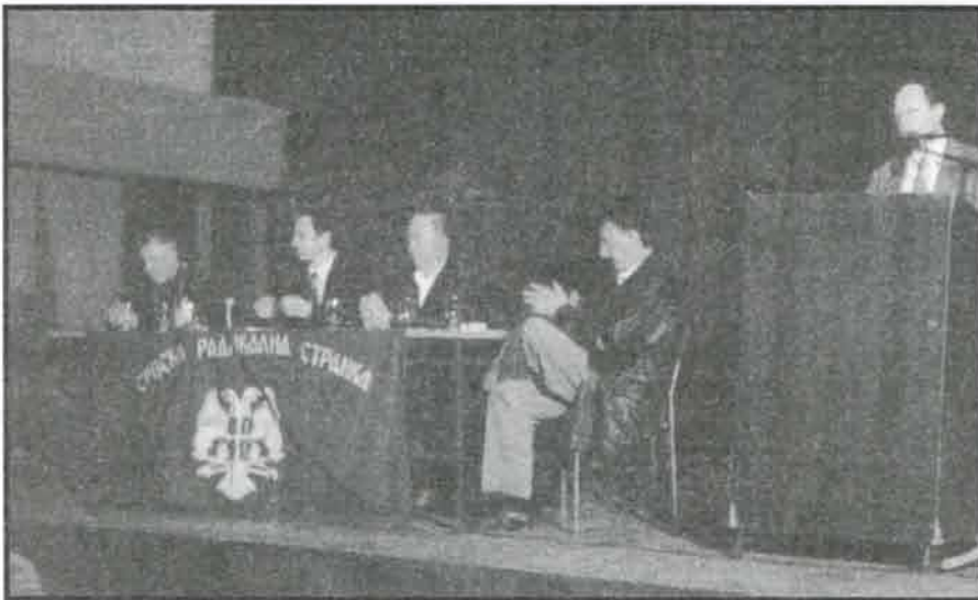
Вршилац дужности председника Општинског одбора подноси извештај о раду у претходном периоду