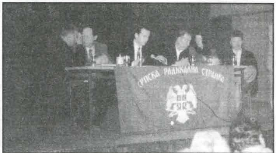
Радно председништво Годишње Скупштине Општинског одбора Српске радикалне странке - Параћин