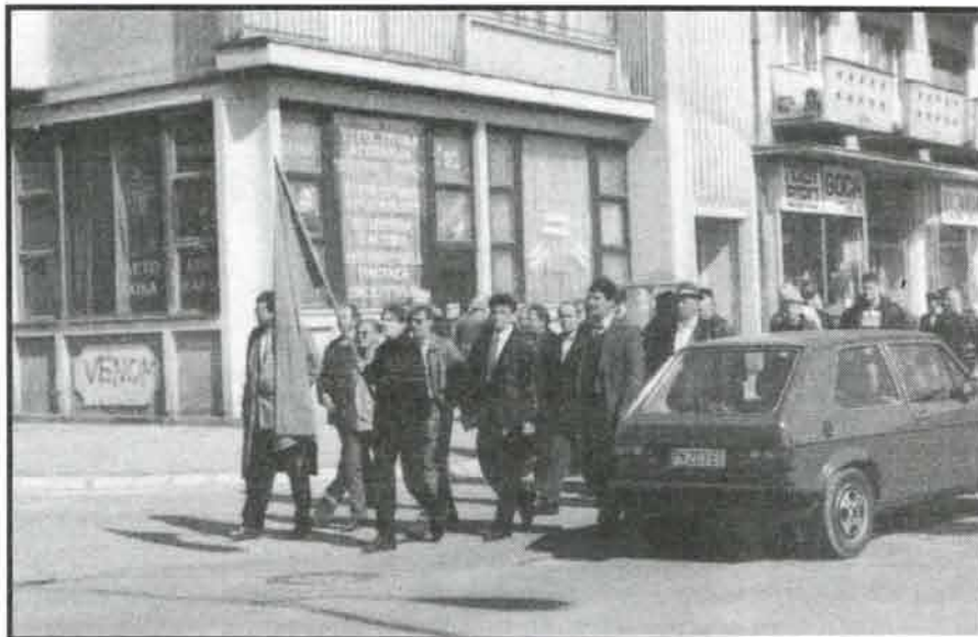
Долазак из Цркве на Скупштину

"Пошто је ово прва редовна Скупштина нашег Општинског одбора, проширио бих анализе на период од Савезних и Локалних избора 1996. године. Тада смо тек почињали са