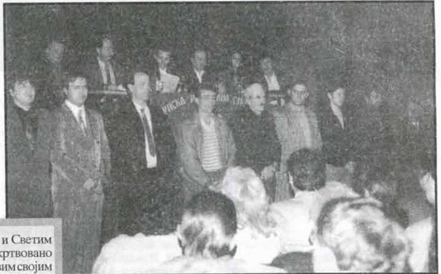
Новоизабрани чланови ОО СРС Параћин полагају заклетву пред делегатима Скупштине