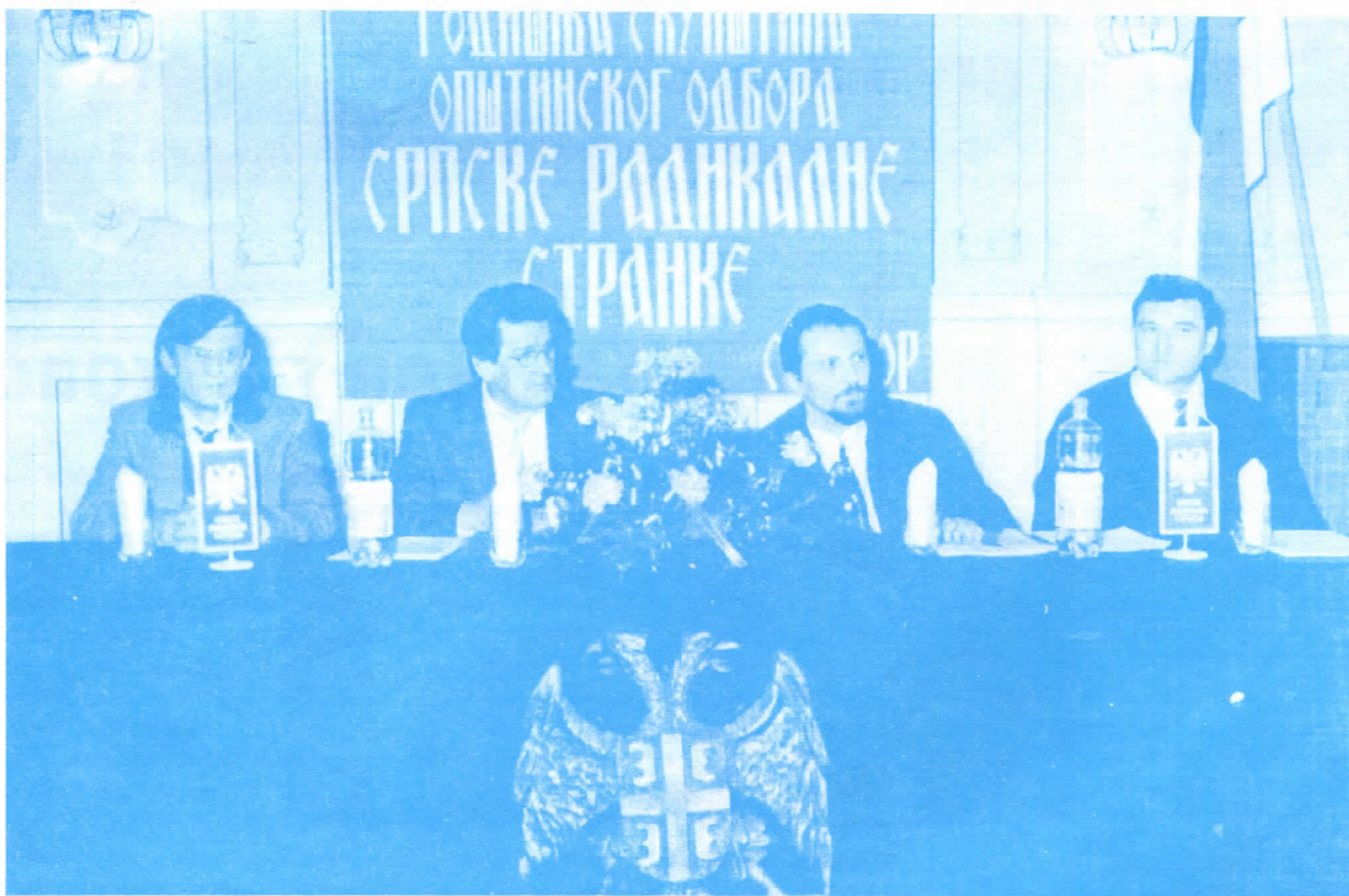
Са Годишње скупштине сомборских радикала

Прва годишња скупштина Општинског одбора Српске радикалне странке у Сомбору, одржана 14. марта у Старој градској кући, протекла је у примерном празничном и радном расположењу бројног чланст-