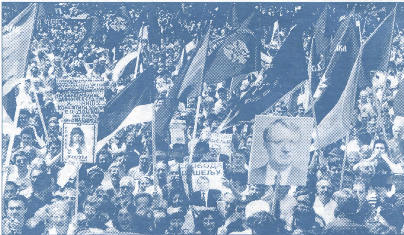
СВЕ ЗА СРПСТВО, А СРПСТВО НИЗАШТА!

Српски радикали су и током рата били свесни оваквог стања у тада вла-