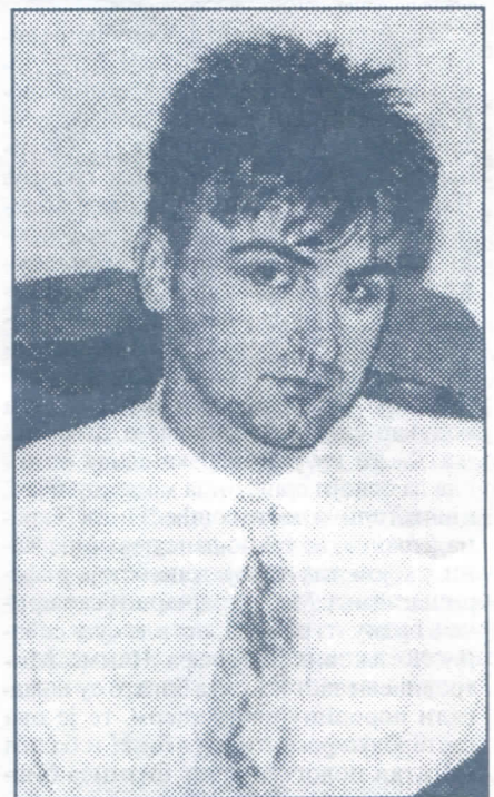
Жељко Митровић - Савезно министарство "српском Теду Гарнеру" ипак одбило захтев за други програм "Пинка"

Тешко је поверовати, али је и домаћи медијски магнат, Жељко Митровић, данас власник "Медија система", чак три радио-станице, "Пинк" телевизије, дискографске куће "Сити рекордс", луксузног личног возног парка, обезбеђења и велелепне футуристичке палате у срцу Сењака, некада "волео све што воле млади". Утолико пре, ако се зна да је многогледани и слушани, више него комерцијални програм његових медија, управо образац онога што ниједна уређена држава не би препоручивала својим нараштајима као духовну храну.