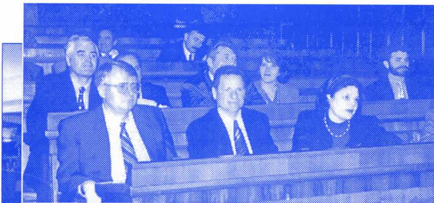
Др ВОЈИСЛАВ ШЕШЕЉ СА ПОСЛАНИЦИМА СРС У САВЕЗНОЈ СКУПШТИНИ

У два изборна круга он је већ добио поверење већине народа. Постао је израз њихове воље и мера њихових потреба.