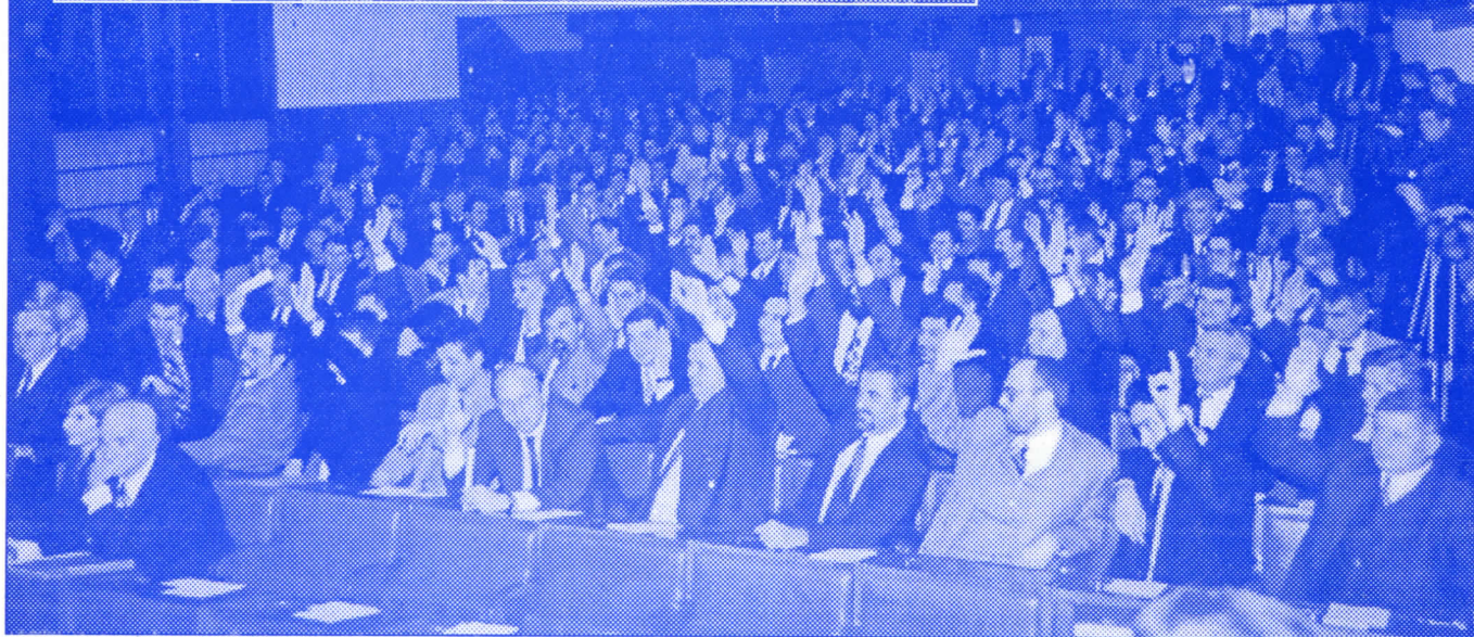
У НОВОМ САЗИВУ СКУПШТИНЕ СРБИЈЕ СРС ИМА ДУПЛО ВИШЕ ПОСЛАНИКА НЕГО У ПРЕТХОДНОМ САЗИВУ (од укупно 250 посланика СРС има 82)