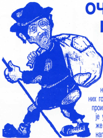
САДАШЊА ВЛАСТ ГАРАНТУЈЕ ЛЕПУ БУДУЋНОСТ ГРАЂАНИМА СРБИЈЕ